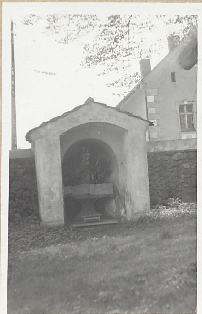
Wierzbnik-kapliczka przy murze