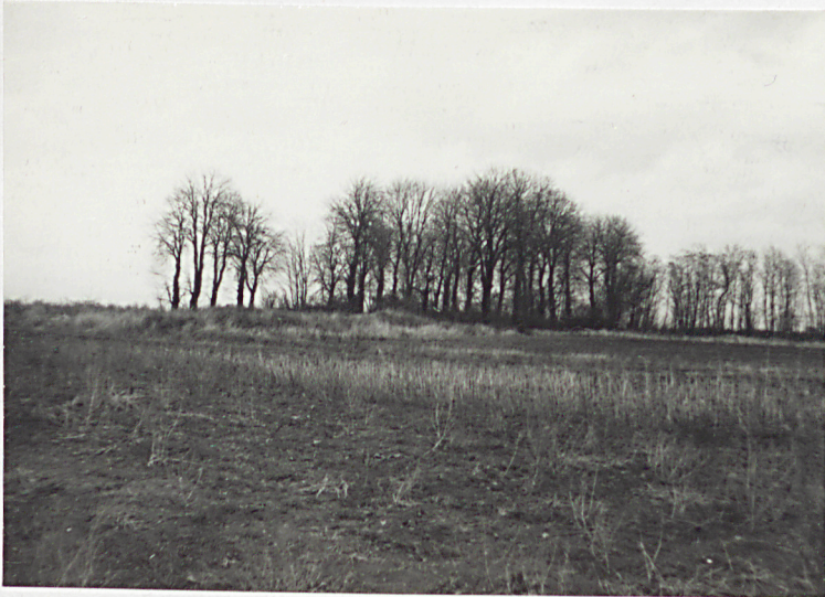
1. Widok cmentarza od strony zachodniej