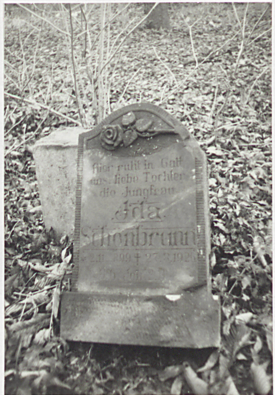
3. Jedyna zachowana pionowa płyta nagrobna z 1926 r.