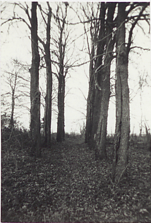
2. Obsadzona kasztanowcami alejka główna