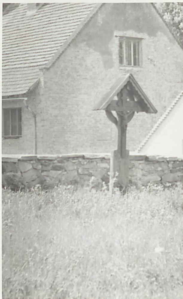
Jędrzejów - grób przy murze