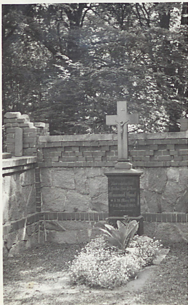
Grób na cmentarzu w Jędrzejowie