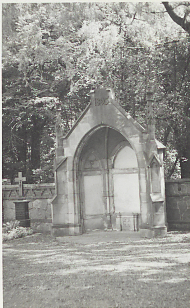
Grobowiec w Jędrzejowie