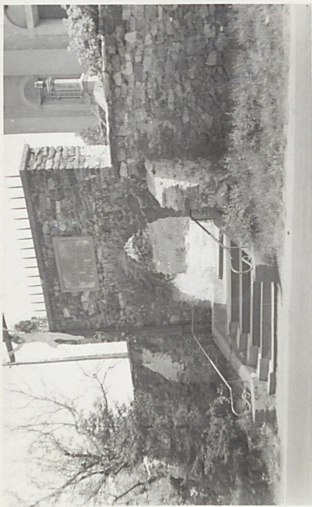
Brama wejściowa z tablicą w Jędrzejowie