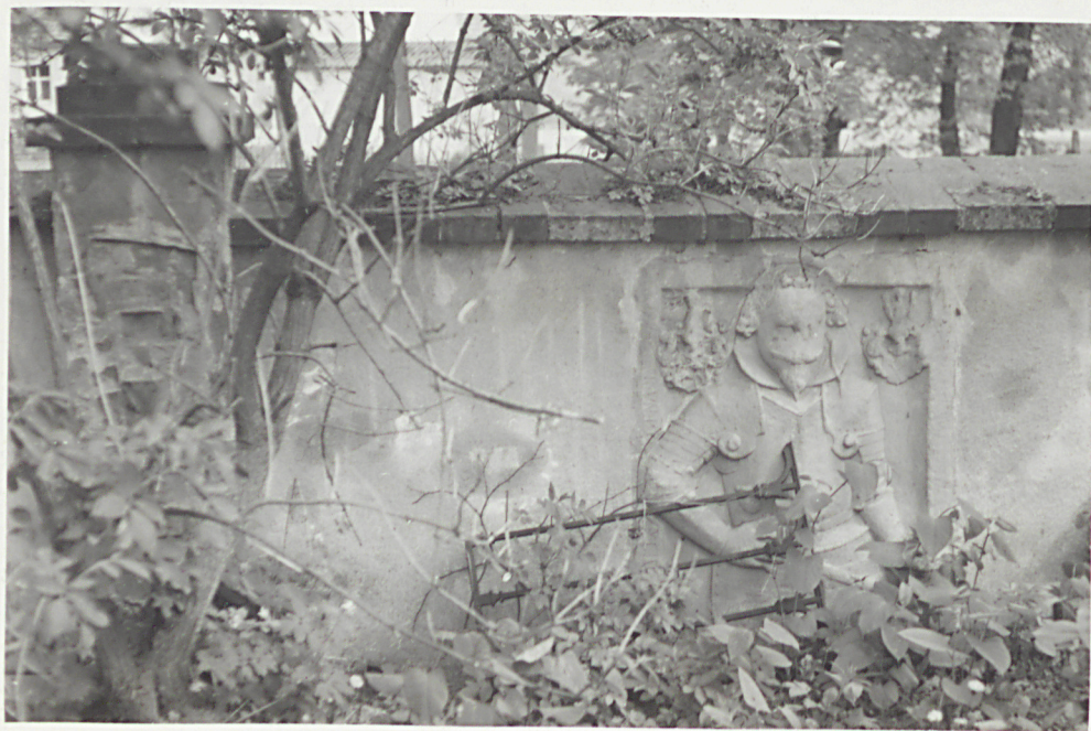
Rzeźby na murze k.bramy w Gnojnej