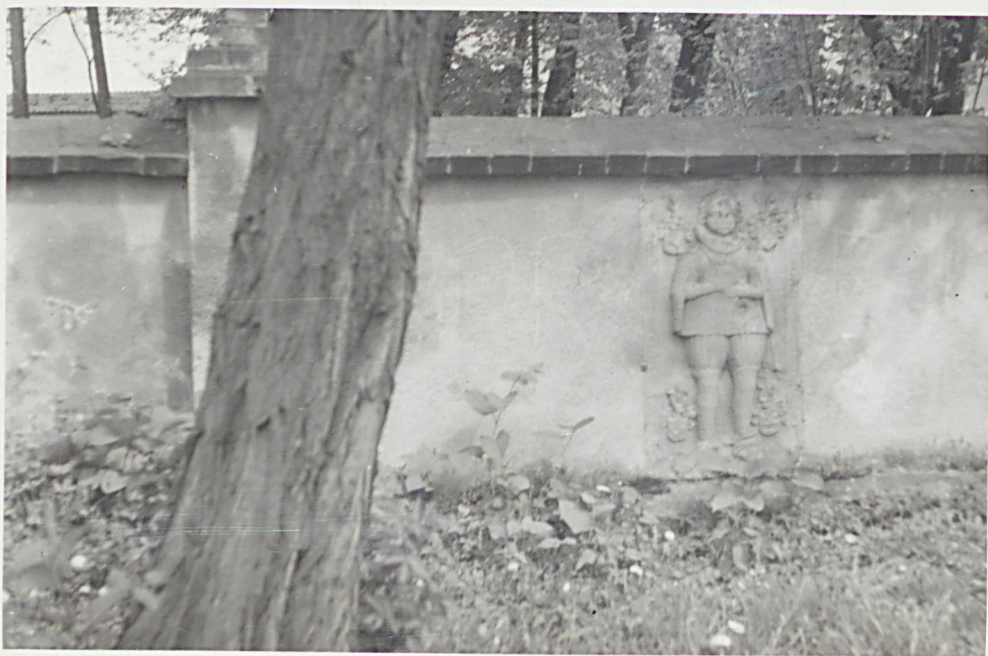
Rzeźby na murze k.bramy w Gnojnej