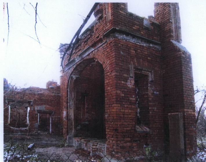
2. Fragment aneksu bocznego od strony pn.-wsch.