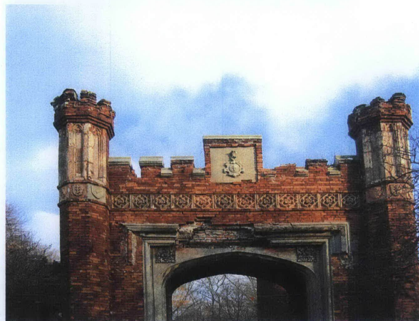
3. Widok od zach., fragment attyki