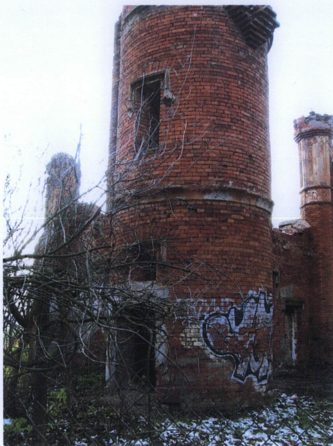
1. Przyziemie aneksu wieżowego od wsch.