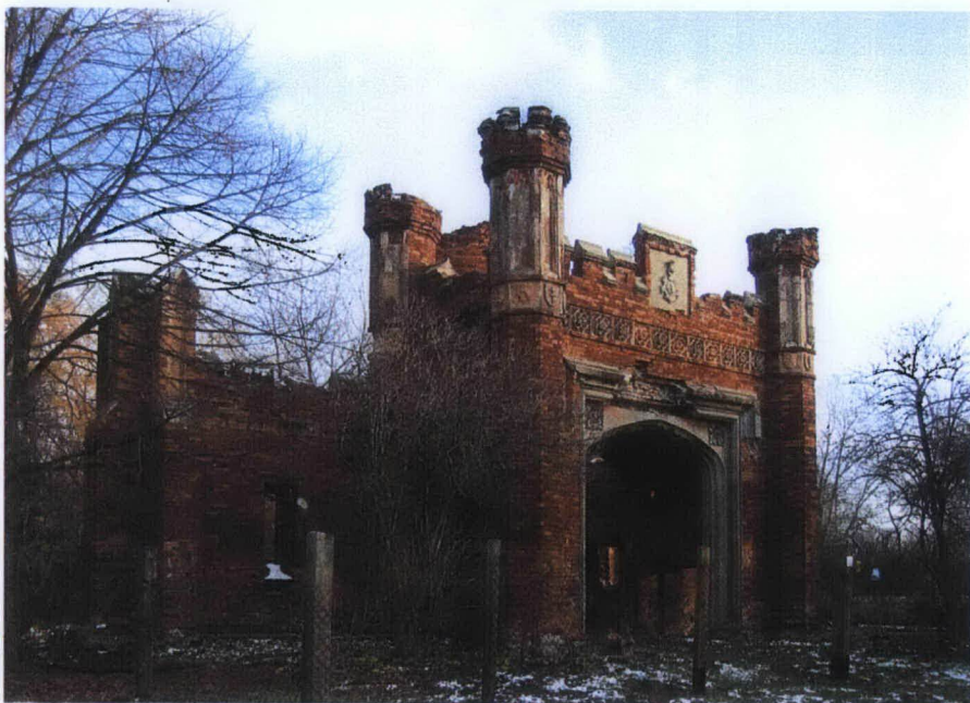
3. Widok od pn.-zach.