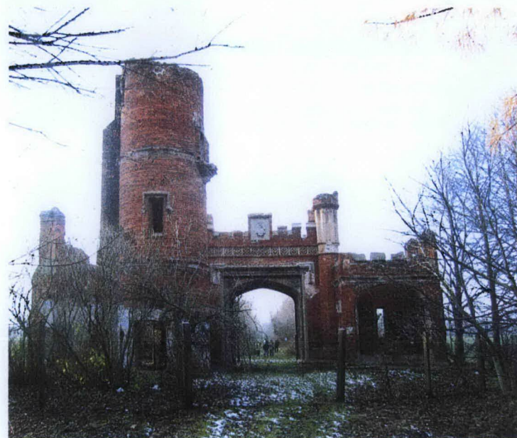
2. Widok od wsch.