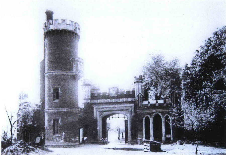
1. Widok od wsch., stan z 1915 r.