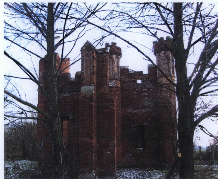
3. Elewacja boczna od pn.