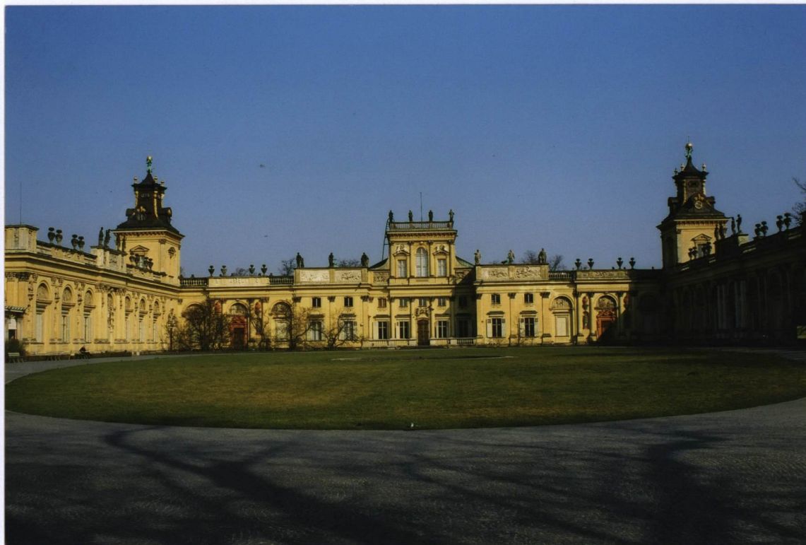
ELEWACJA OGRODOWA PAŁACU

6. Zawartość wkładki (nazwa materiału uzupełniającego)