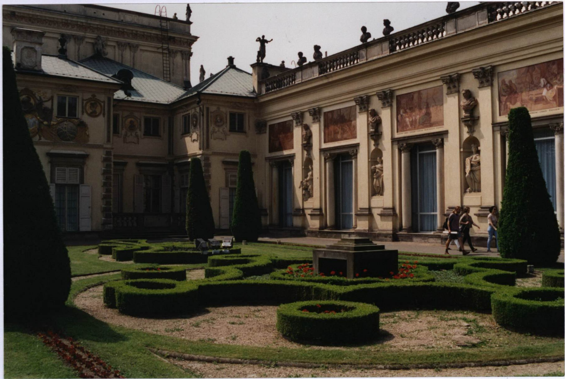
FASADA PAŁACU