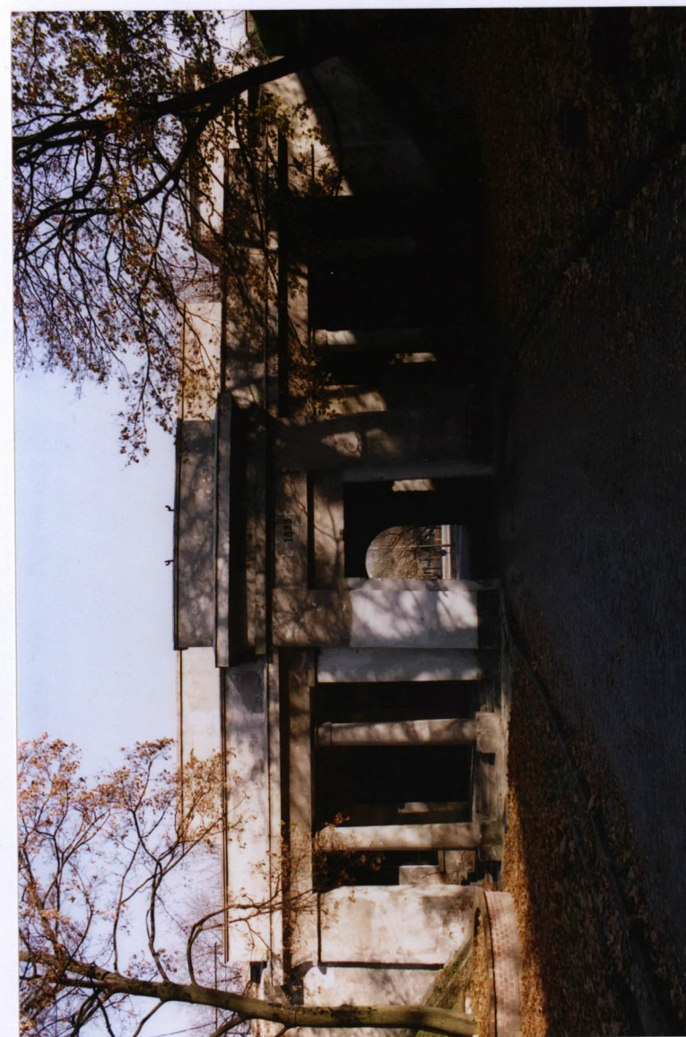
BRAMA GŁÓWNA OD WEWNĄTRZ