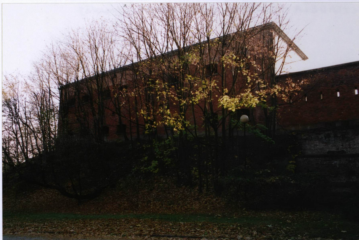
BASTION OBOK BRAMY GŁÓWNEJ