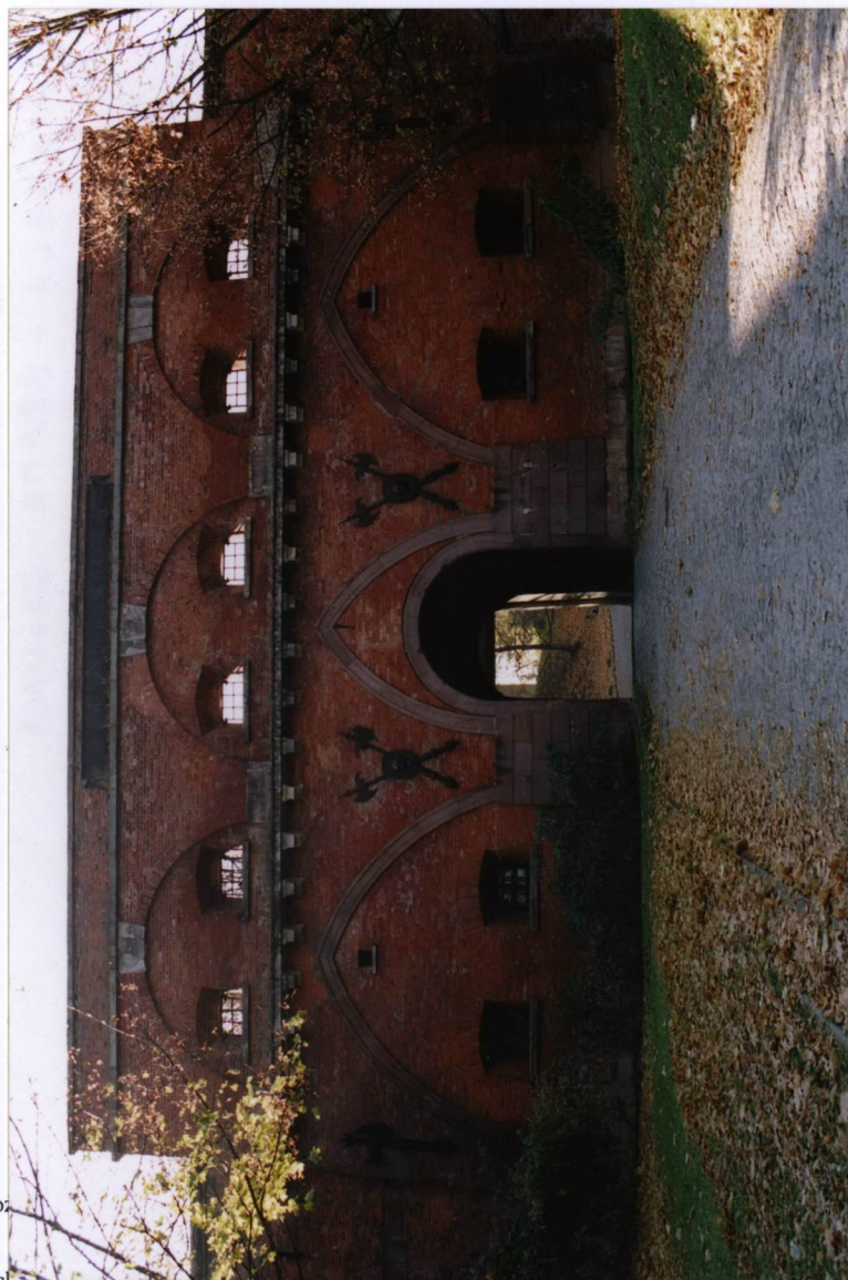
BRAMA GŁÓWNA

6. Zawartość wkładki (nazwa materiału uzupełniającego)