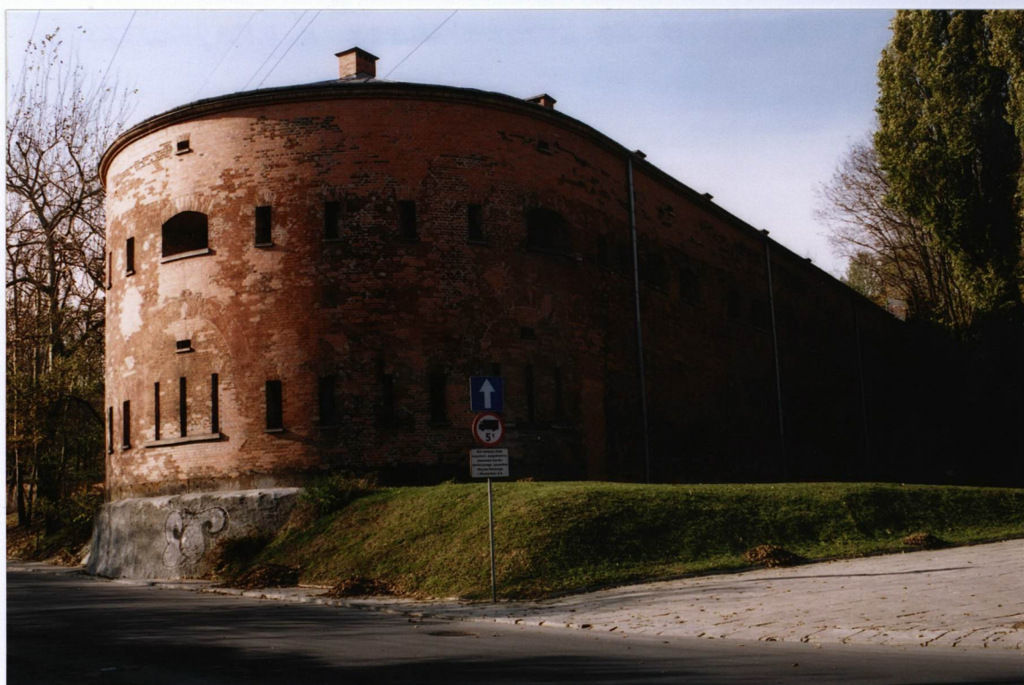
BASTION OD STRONY ULICY H. KRAJEWSKIEGO