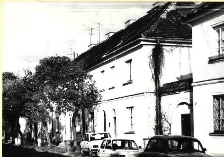
Dom nr 8 we wsch. pierzei, widok ku pn.