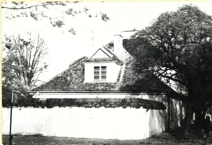
Dom nr 1 zamykający od południa zachodnią pierzeję ulicy