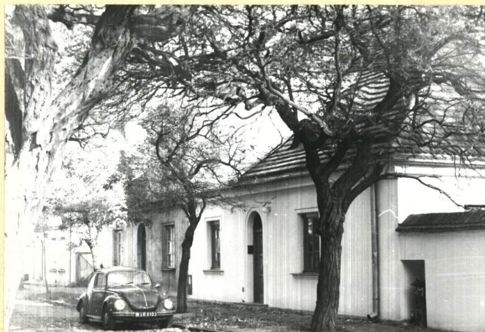
dom bliźni, nr 2