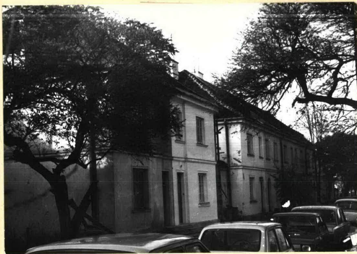
Zach. pierzeja ulicy, widok części środkowej w kier. pn.