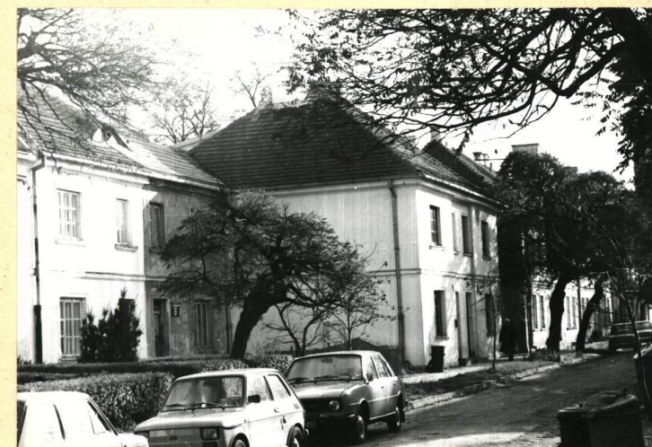
Srodkowa część pierzei wsch., widok ku pd.