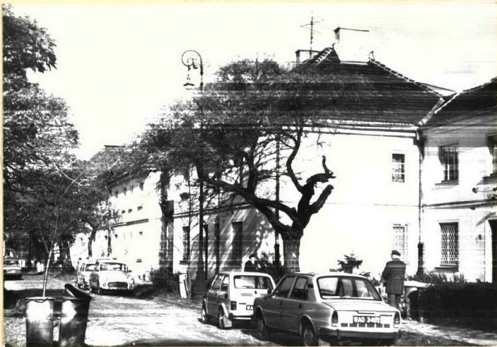
Wsch. pierzeja ulicy, widok części środkowej w kier. pn.