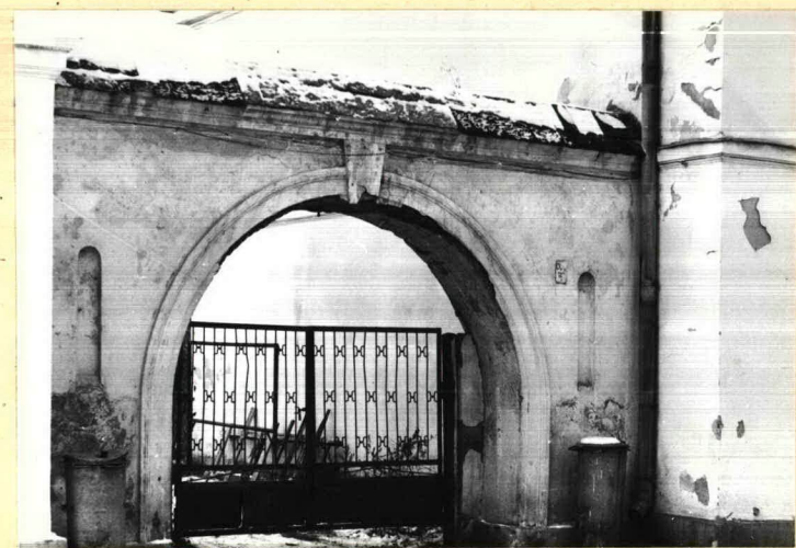
Bramka przejazdowa między domami nr 5m10 i 7