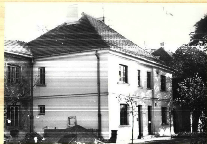
dom dwurodzinny, nr 6m1,2