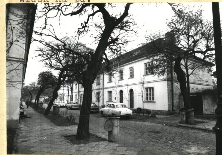
Zach. pierzeja ulicy, widok w kierunku południowym (dom nr 7)

Wkładkę założył: Ewa Kornysz, XI 1985 (imię, nazwisko, data)