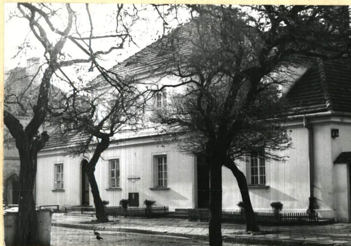
dom bliźni nr 9, zamykający od pn. zachodnią pierzeję ulicy