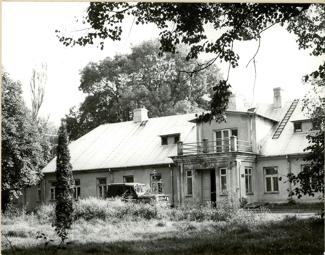
Fot. 1. Szymanów. Dwór 10.1981