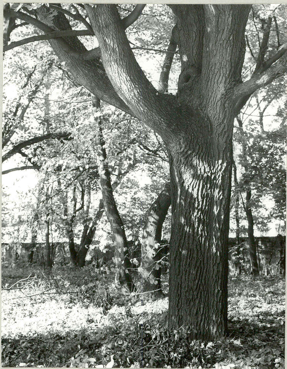
Fot. 3. Szymanów. Południowy fragment parku.