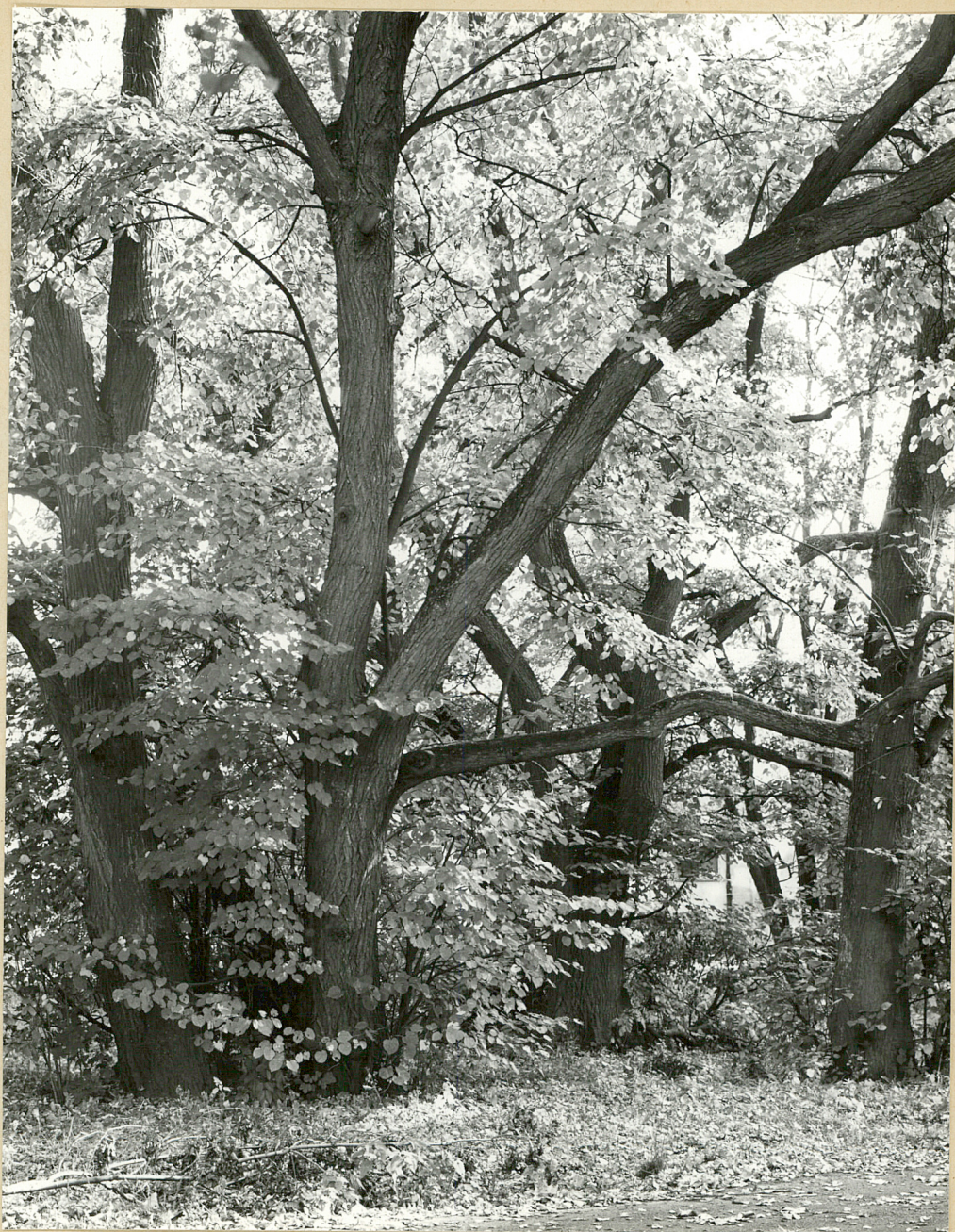
Fot. 2. Szymanów. Kępa starych lip fot. W. Maliński 10.1981