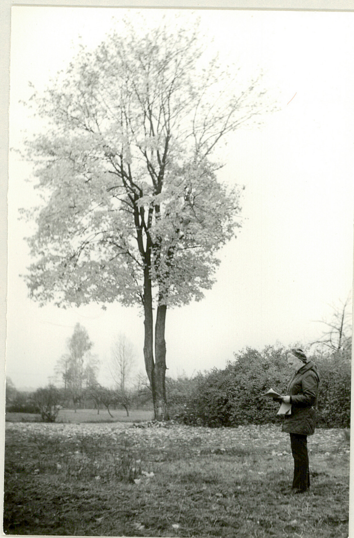
Fot. 5. Klon nr. 25