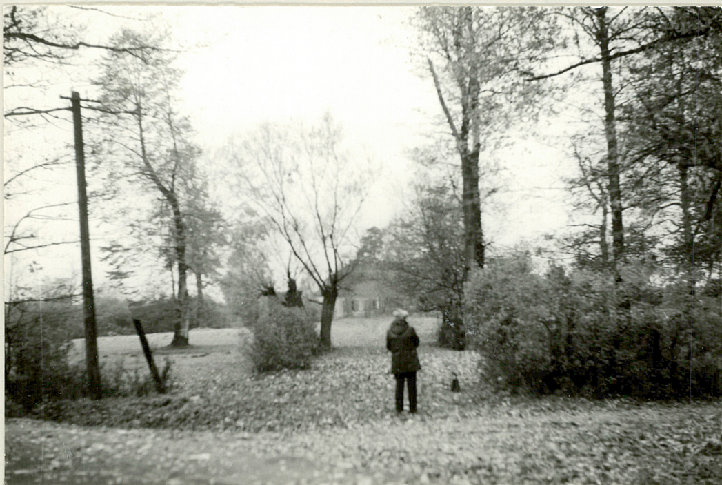
Fot. 1. Dawny wjazd do dworu. Między słupem telegraficznym a krzewami lilaka stała brama wjazdowa