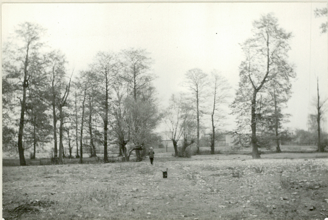
Fot. 2. Pozostałość aleji wjazdowej - widok od dworu. Po lewej stronie olchy nad stawem