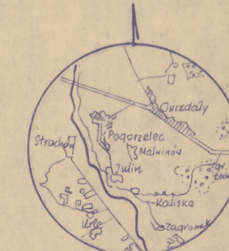
Wzrys z planu sk. 1:10000