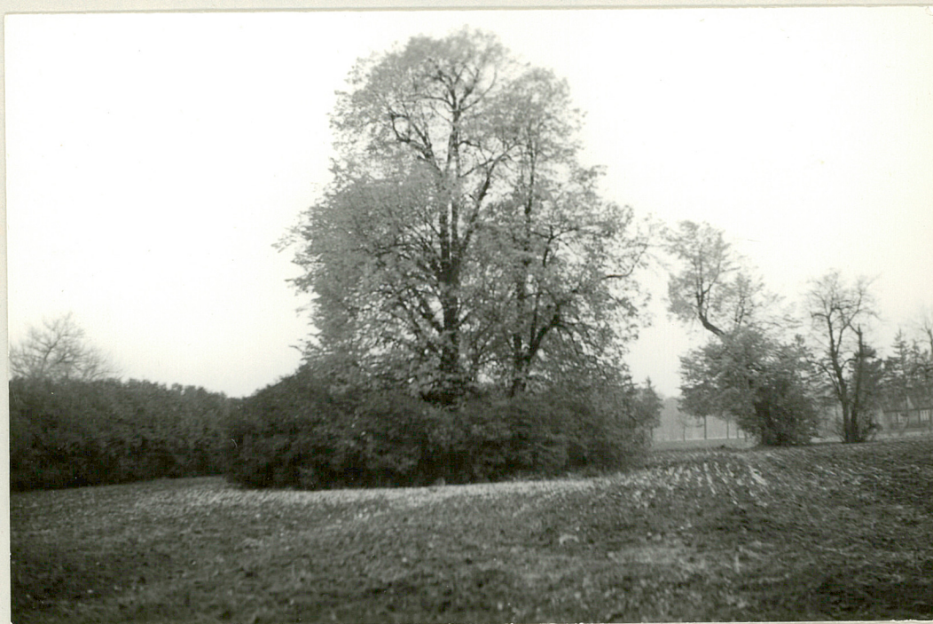
Fot. 4. Cieniownik - zielona altana. W głębi widać pozostałość szpaleru lipowego