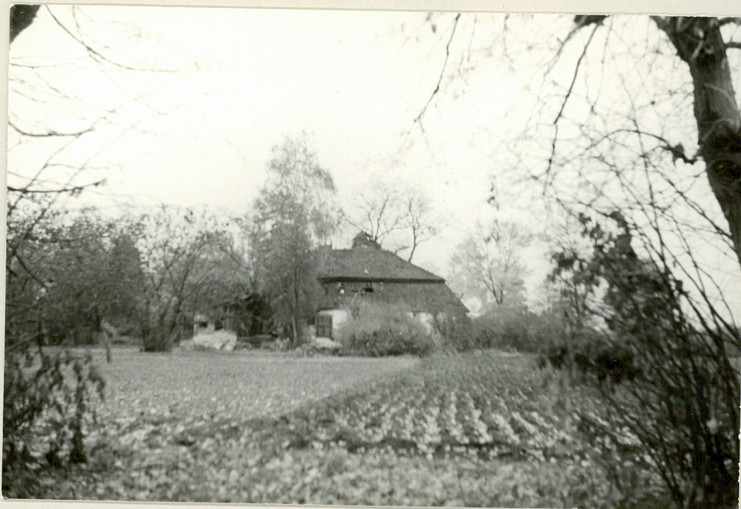
Fot. 8. Widok dworu od strony zachodniej