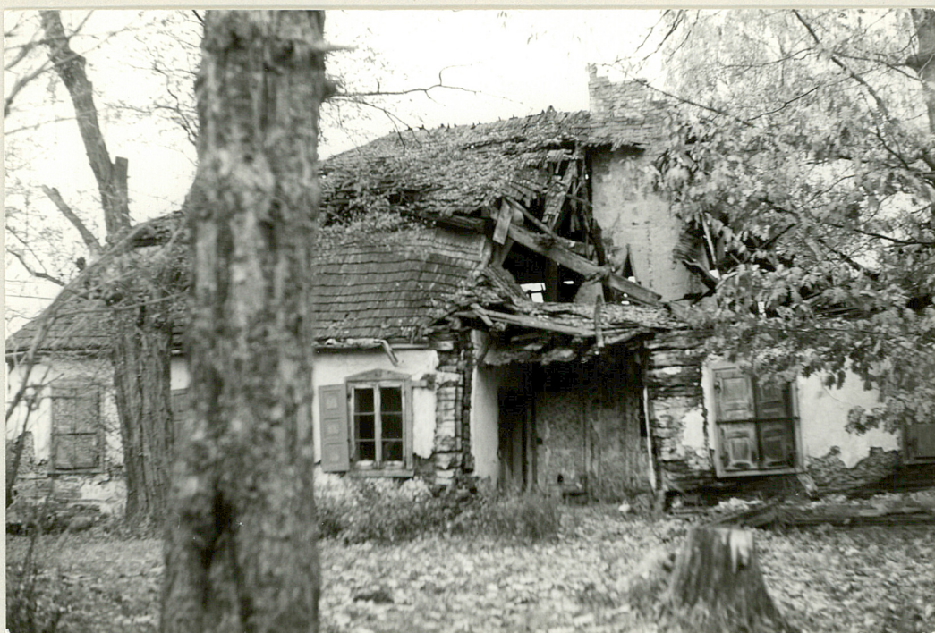
Fot. 3. Dwór z zapadniętym dachem - widok od strony drogi wjazdowej