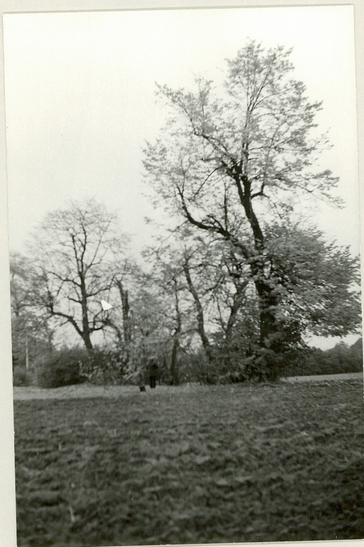
Fot. 9. 5 lip pozostałych z dawnego szpaleru odgraniczającego park od nowego sadu