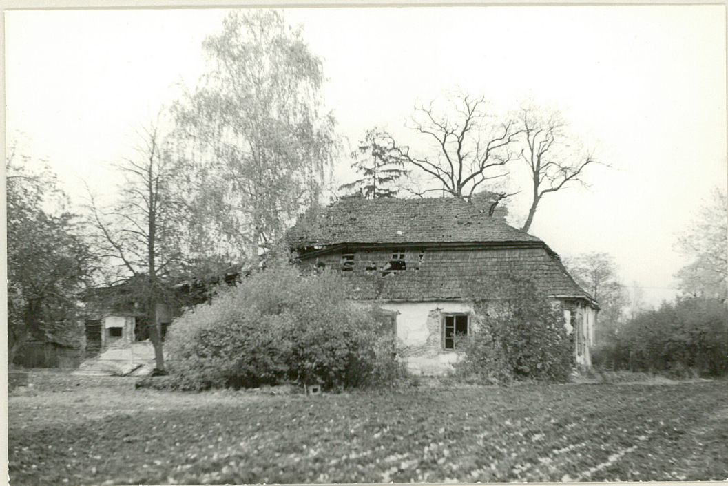
Fot. 7. Zachodnia ściana dworu