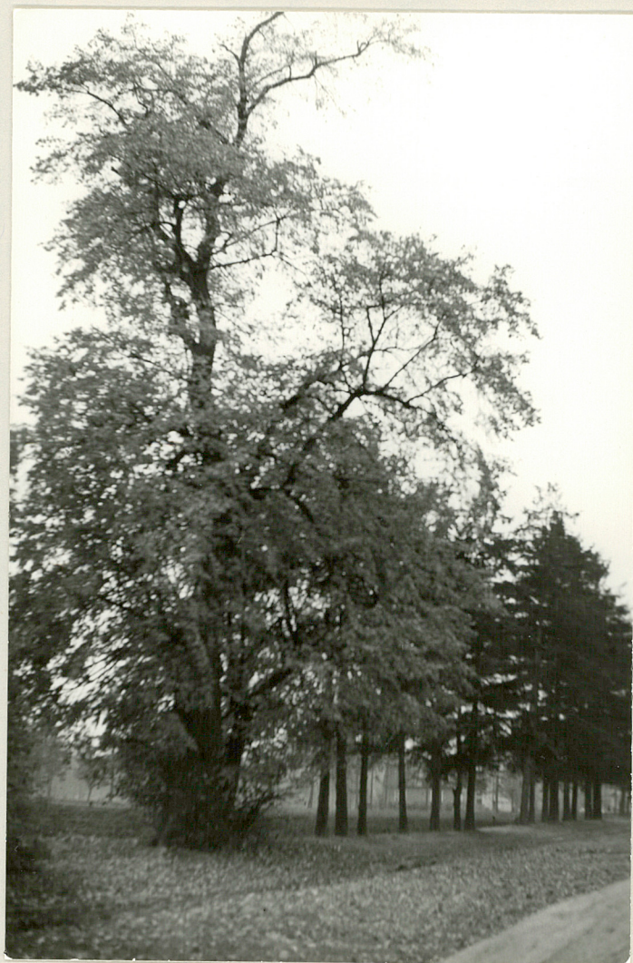
Fot. 10. Lipa nr.6, dalej aleja świerkowa