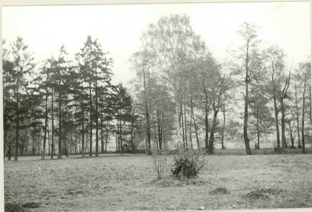
Fot. 6. Po lewej stronie aleja świerkowa, po prawej - drzewa nad stawem