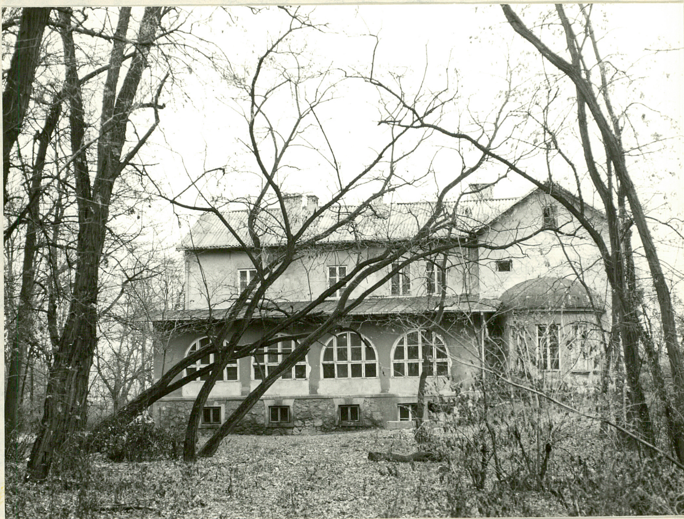
Fot. 2. Strugi. Dwór - "ogród zimowy" 10. 1980