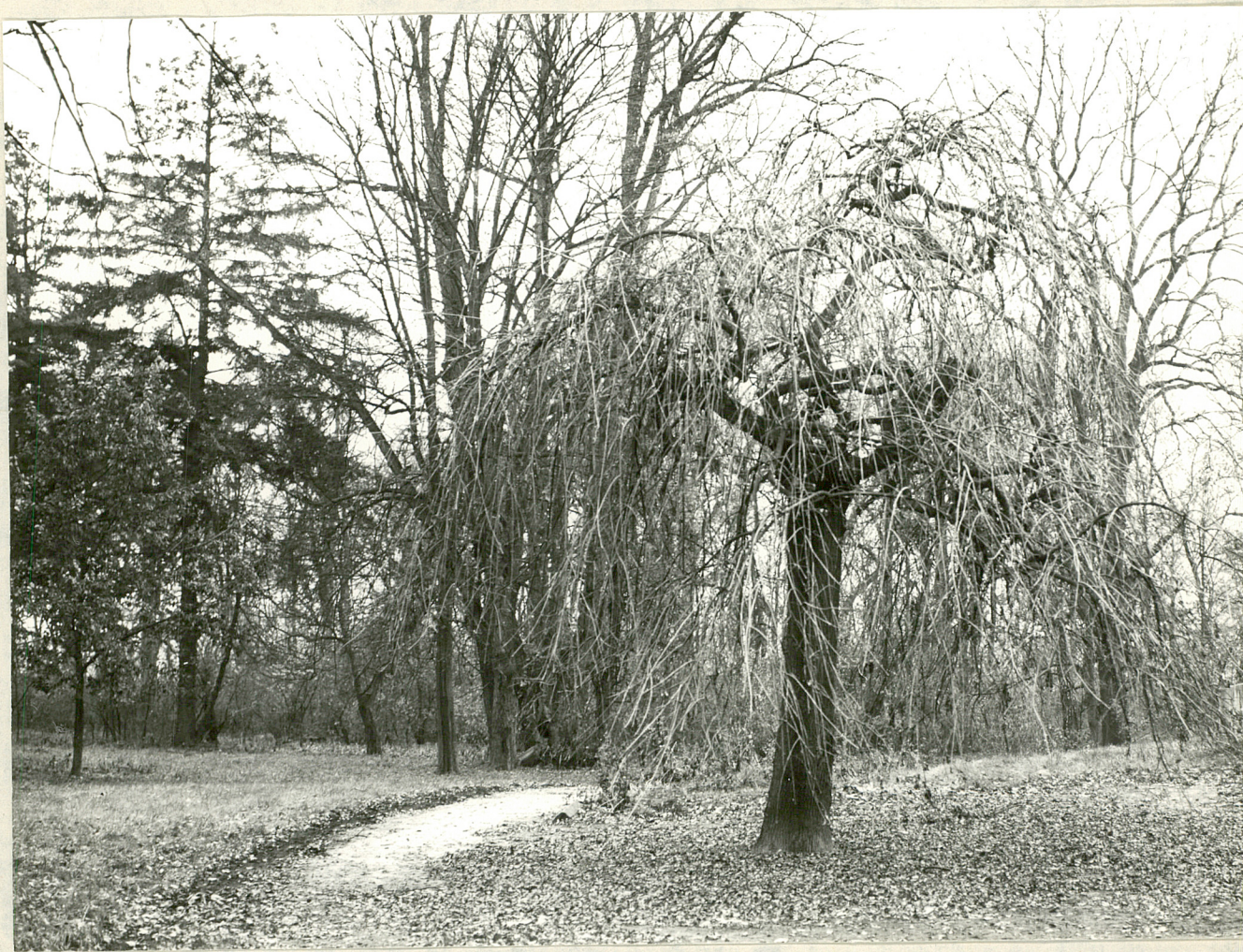
Fot. 3. Strugi. Jesien wyniosły odm. zwisającej