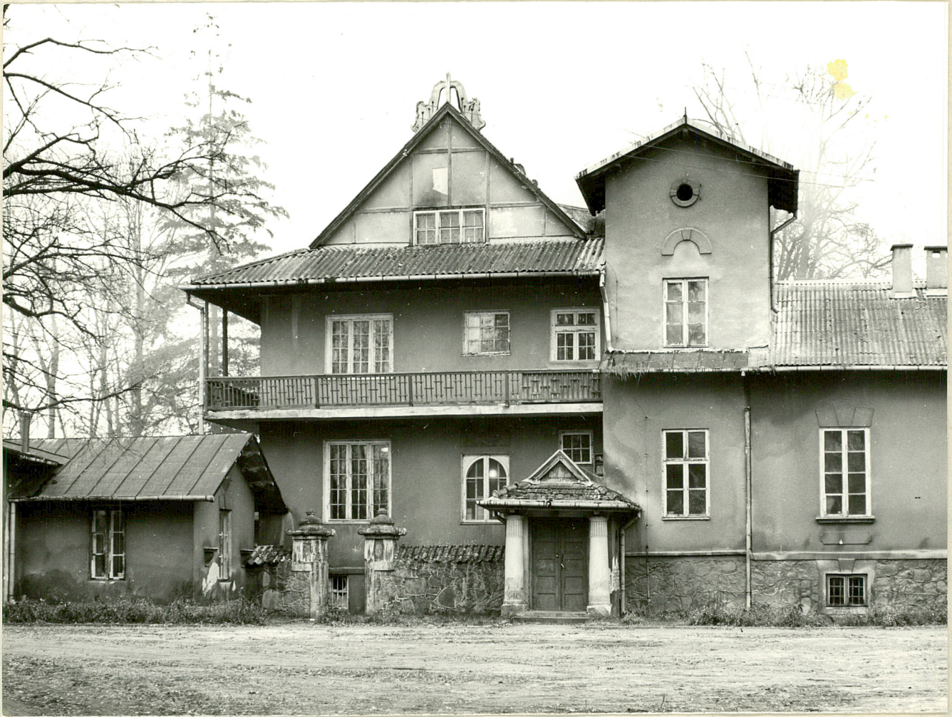
Fot. 1. Strugi. Dwór - "pawilon japoński" 10.1980