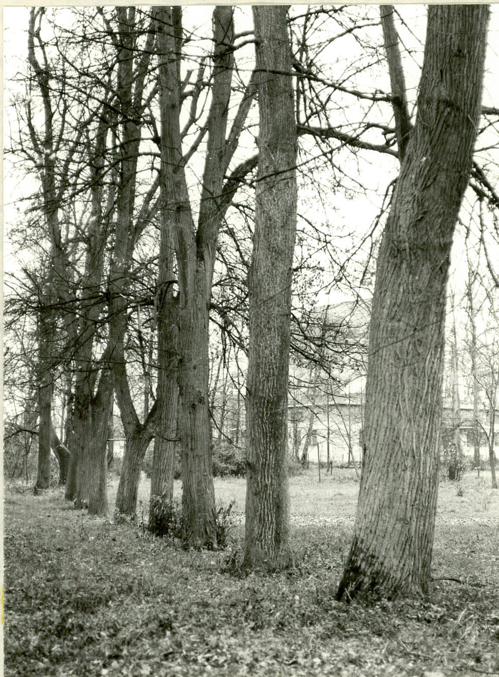
Fot. 5. Strugi. Fragment alei lipowej