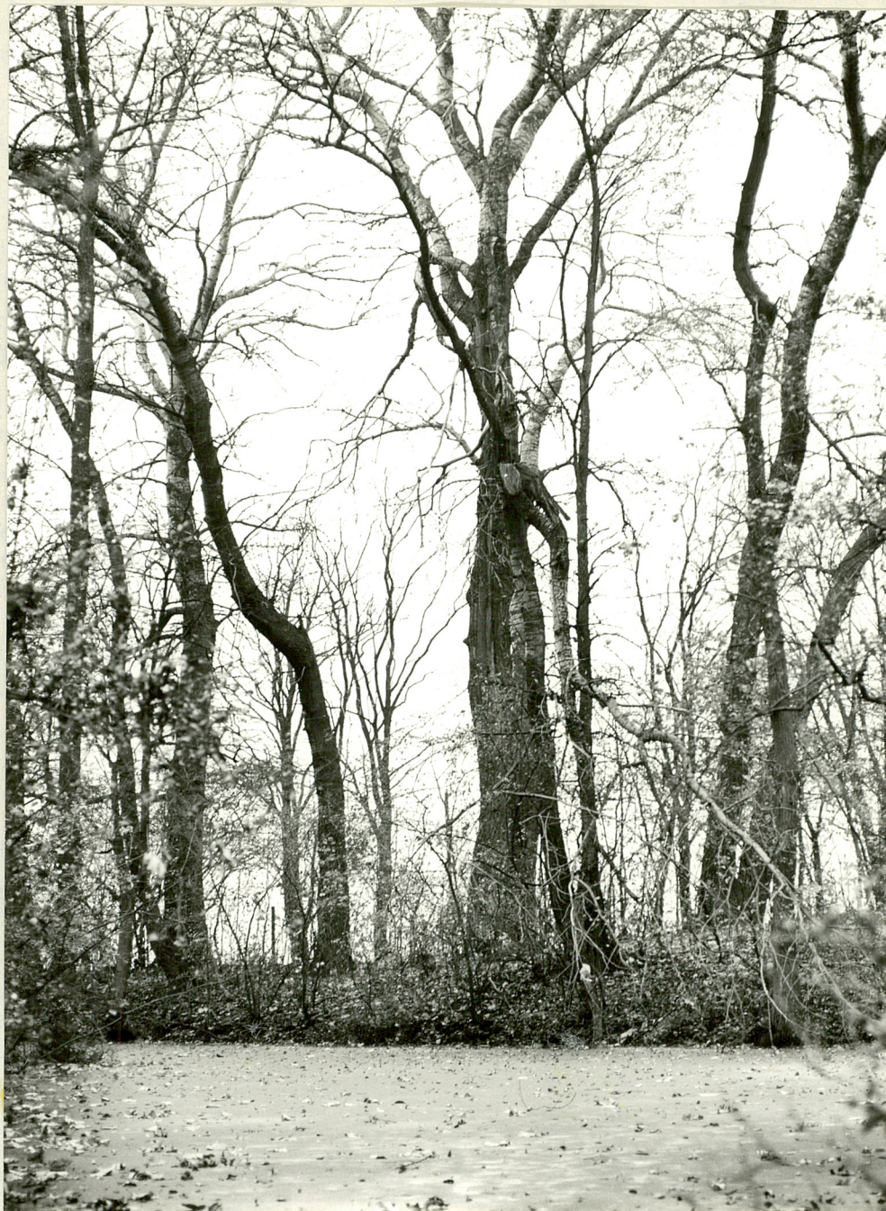
Fot. 4. Strugi. Staw ze starymi białodrzewami nad brzegiem fot. W. Maliński 10.1980