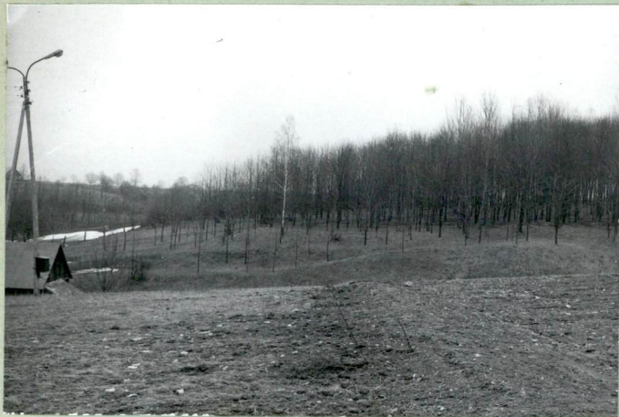
Widok w kierunku zachodnim /park/