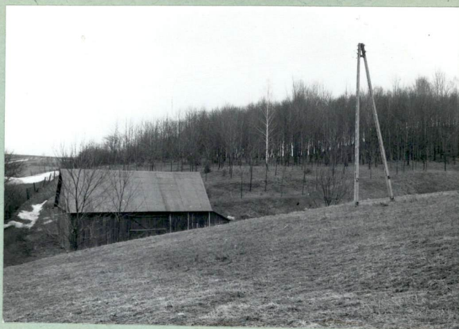
Widok ogólny /park/