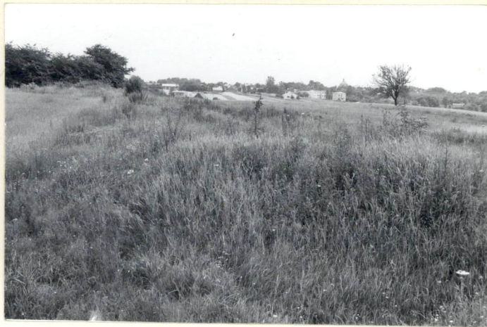
2. Widok w kierunku wschodnim. Na horyzoncie Solec.