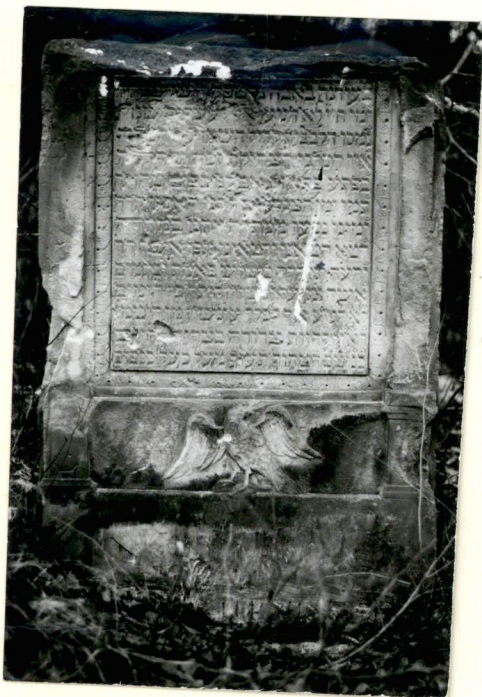
3. Jedyne zachowany nagrobek.