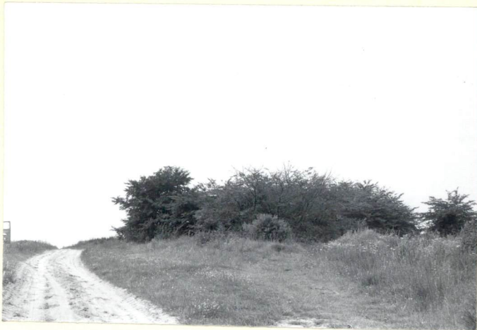
1. Widok w kierunku zachodnim.