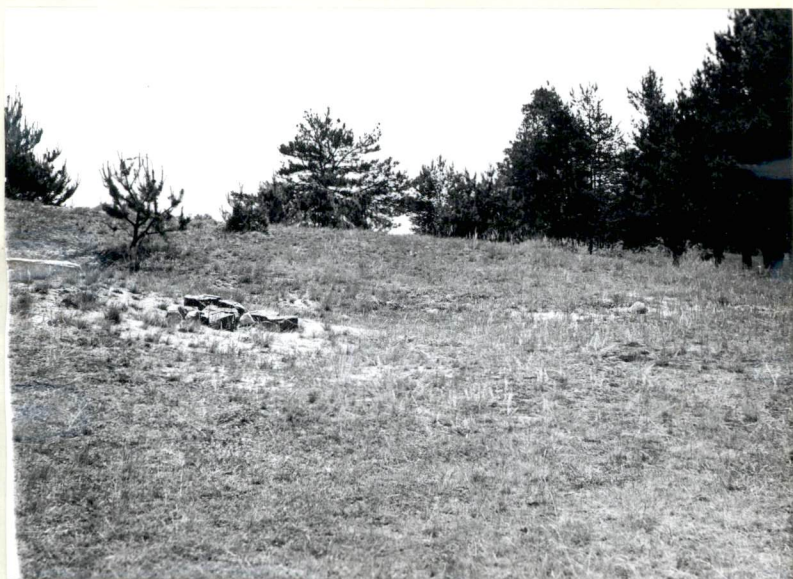
5. Widok w kierunku północno-wschodnim.