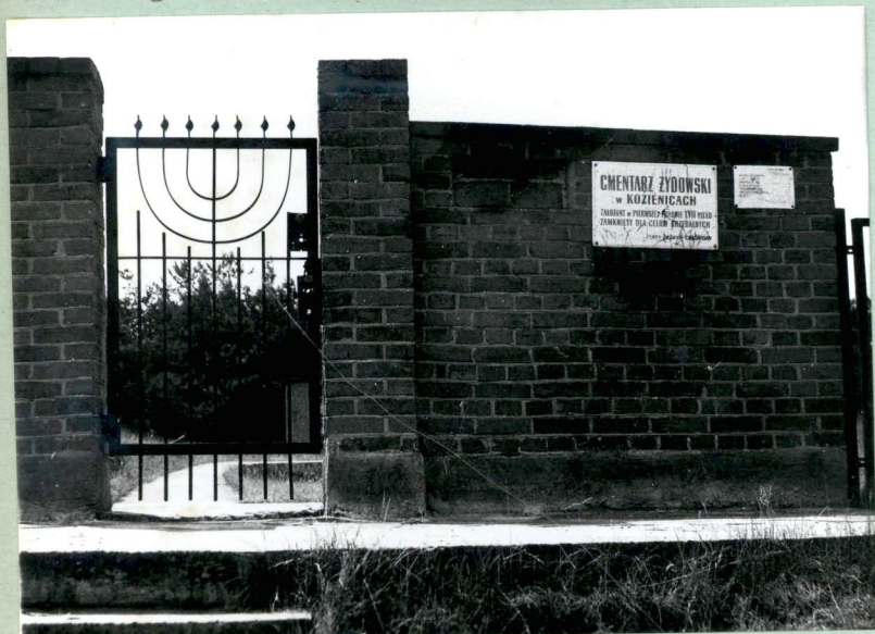
2. Brama cmentarna.