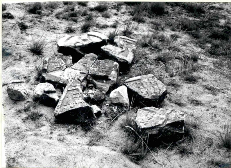
6. Fragmenty nagrobka.