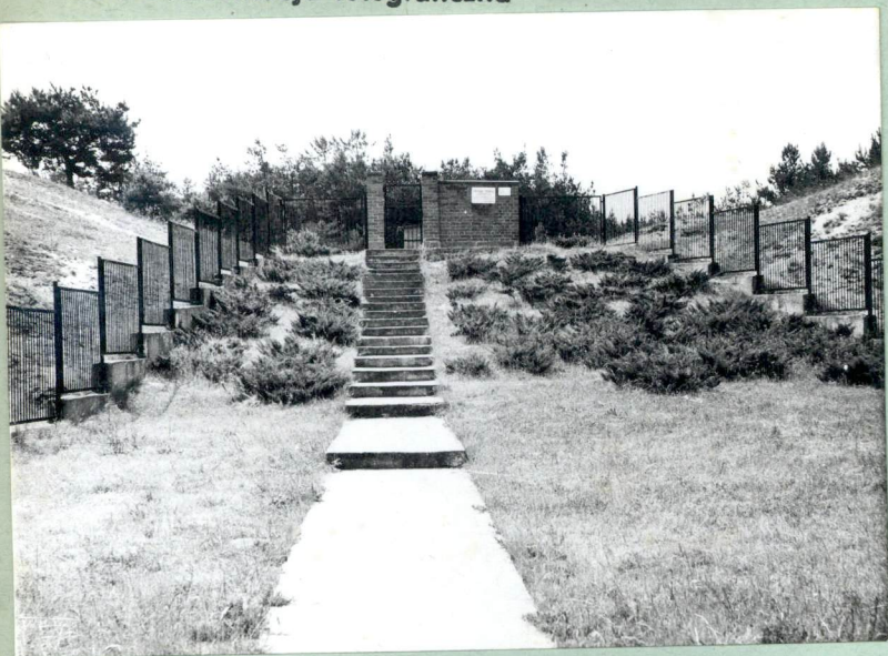
1. Dojście do cmentarza.