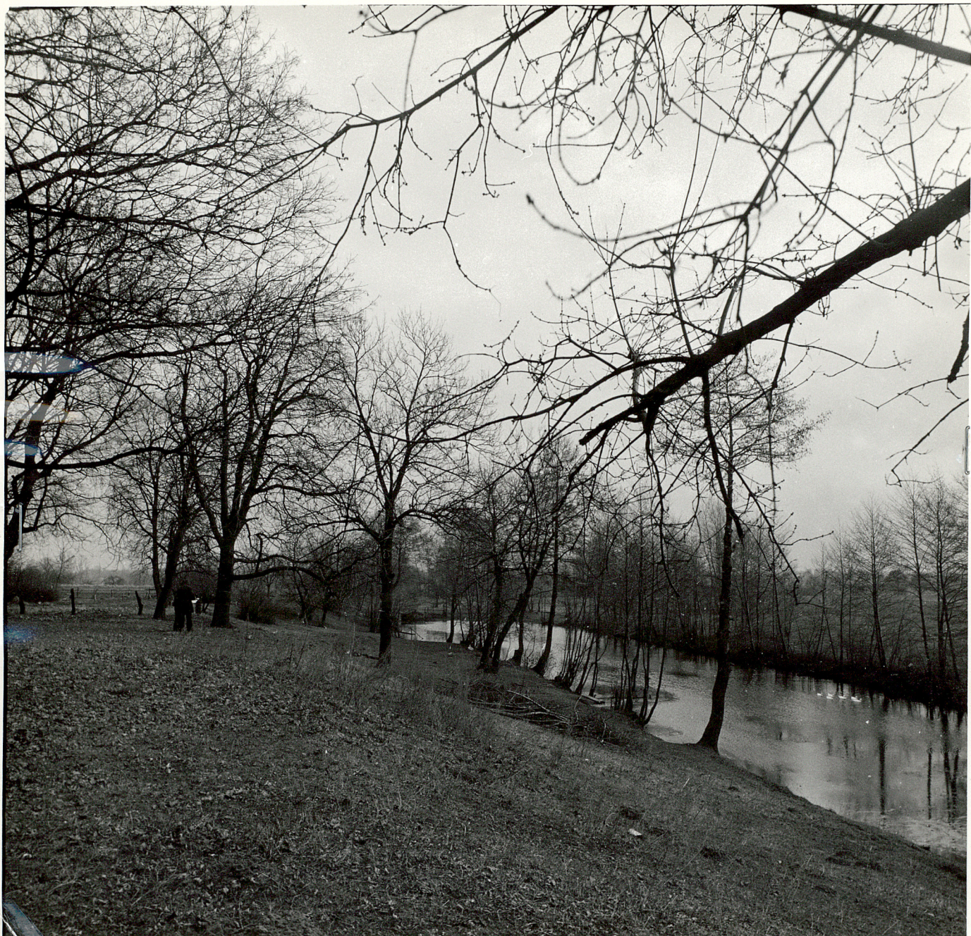
FOT. 5 WIDOK NA SKARPĘ I ROZLEWISKO STRUMIENIA PRZEPLYWAJĄCEGO POD DWOREM W OBIĘRZU OGRODU OD STRONY POŁUDNIOWEJ