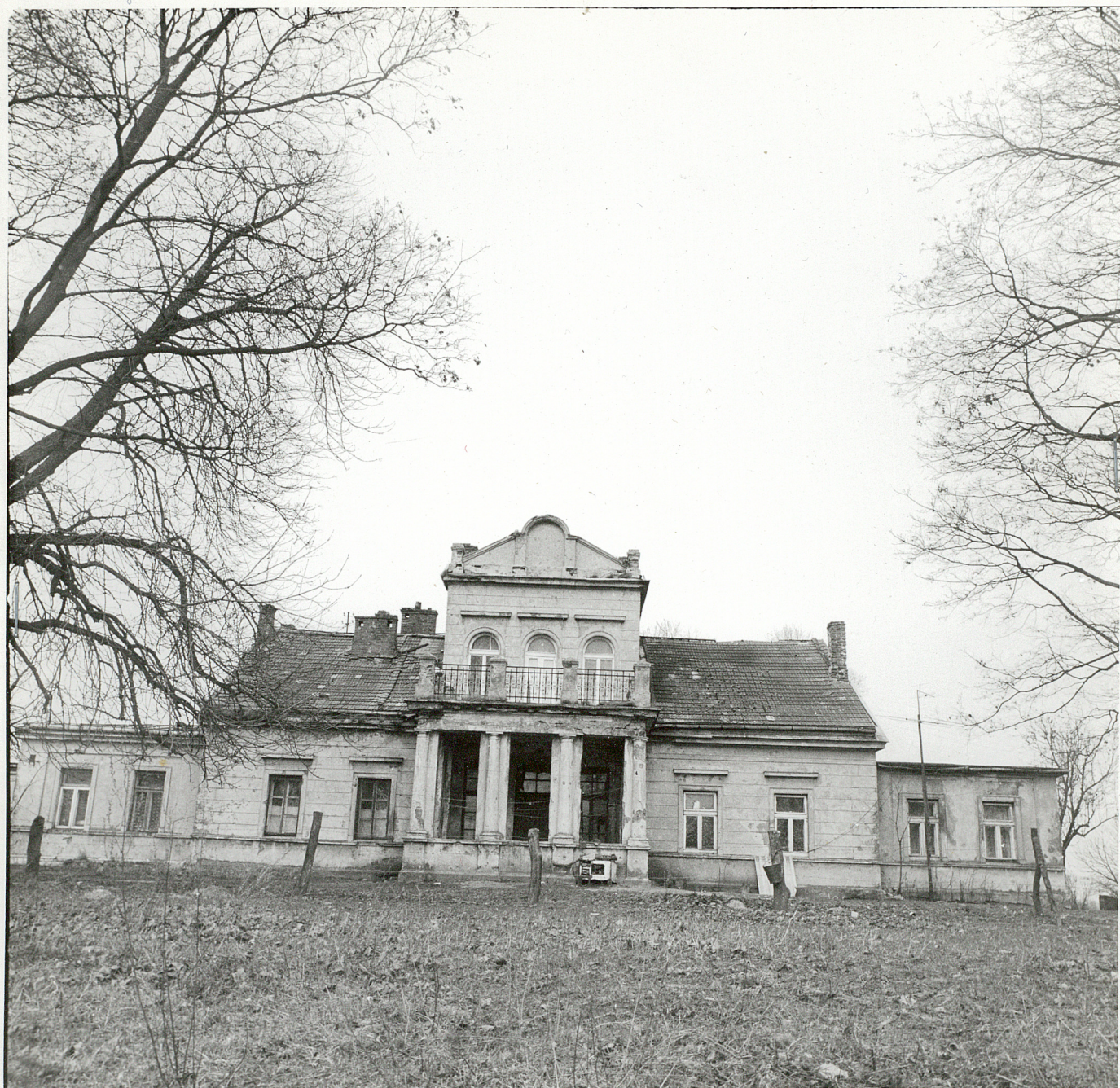
Fot. 1 DWOREK - ELEWACJA PRONTOWA