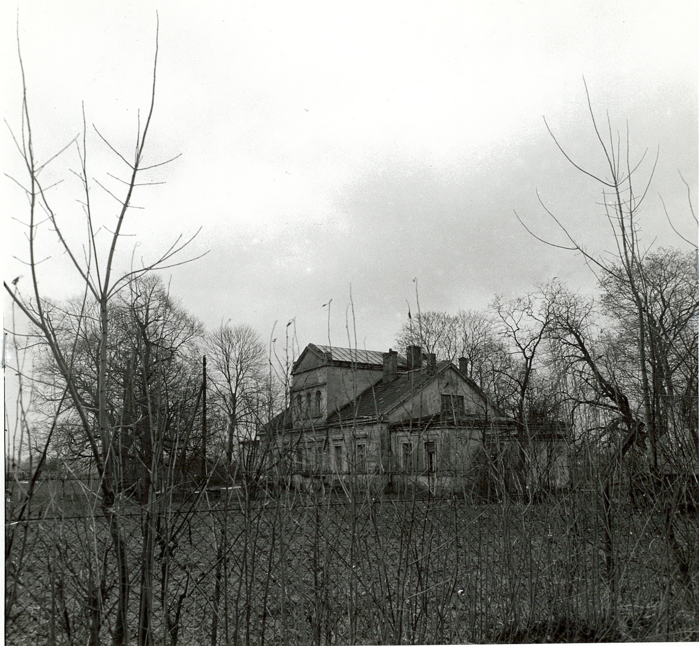
Fot.2 DWOREK - WIDOK OD STRONY OGRODU