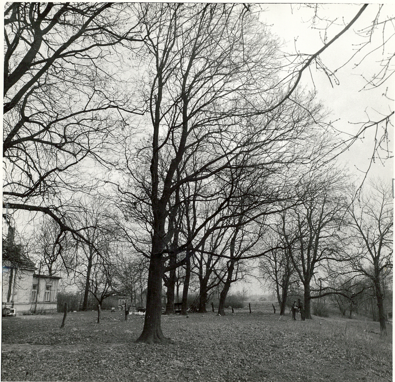
Fot. 4 FRAGMENT ZACHOWANEGO STARODRZEWIA