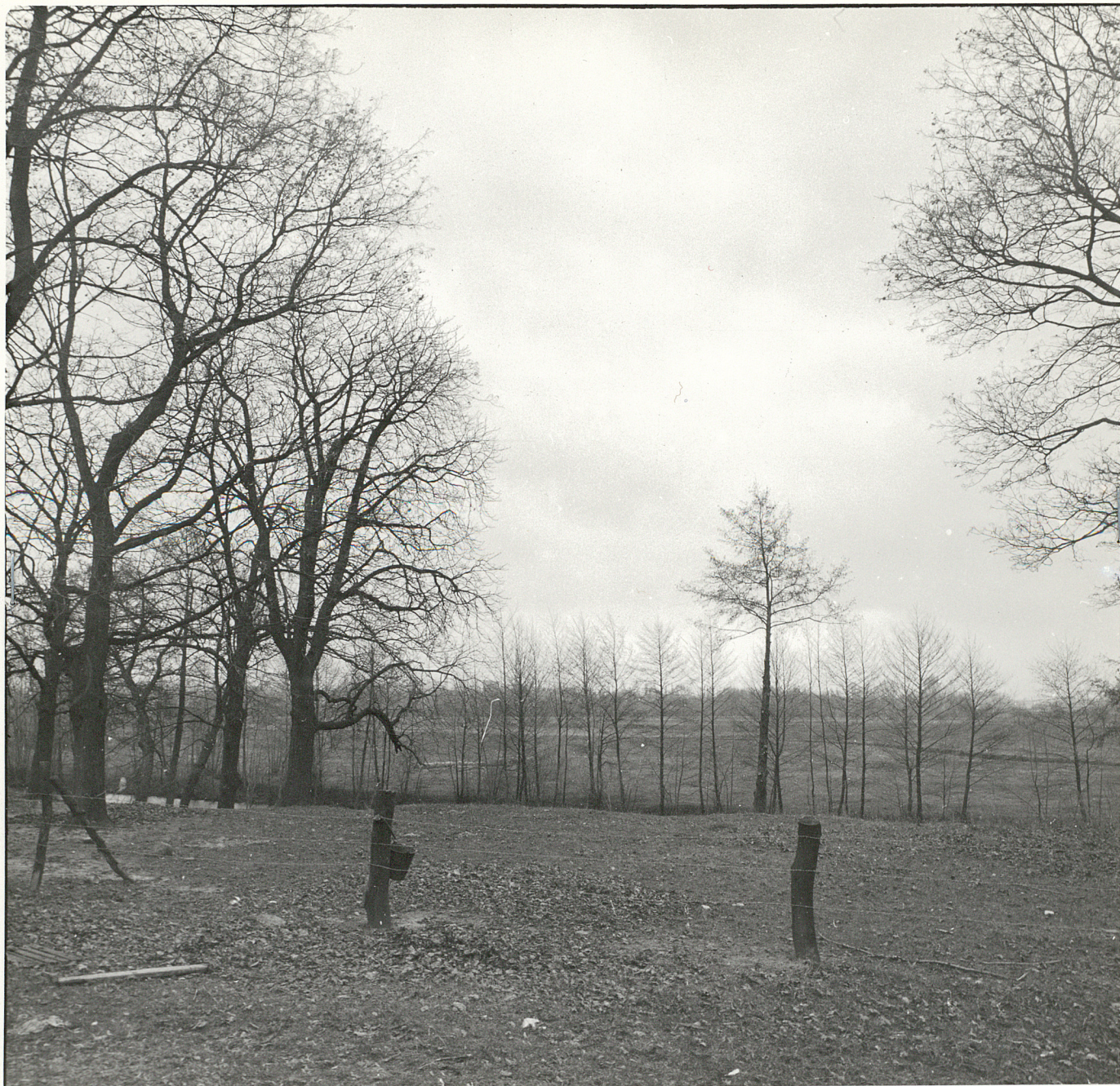
For.3 DOLINA SZURY - WIDOK WZDŁUŻ OSI DAWNEGO ZAŁOŻENIA PUNKT WIDOKOWY