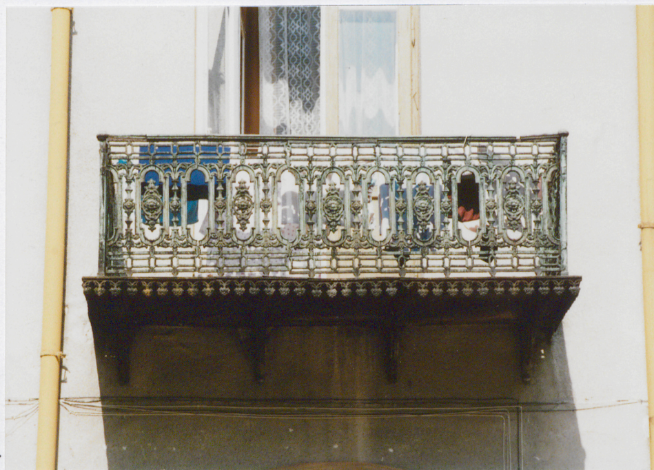
8. Gzyms koronujący. 10. Balkon w elewacji podwórzowej części frontowej.