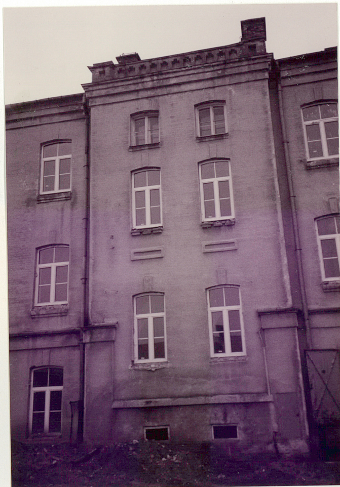
ELEWACJA ZACHODNIA - RYZALIT ŚRODKOWY