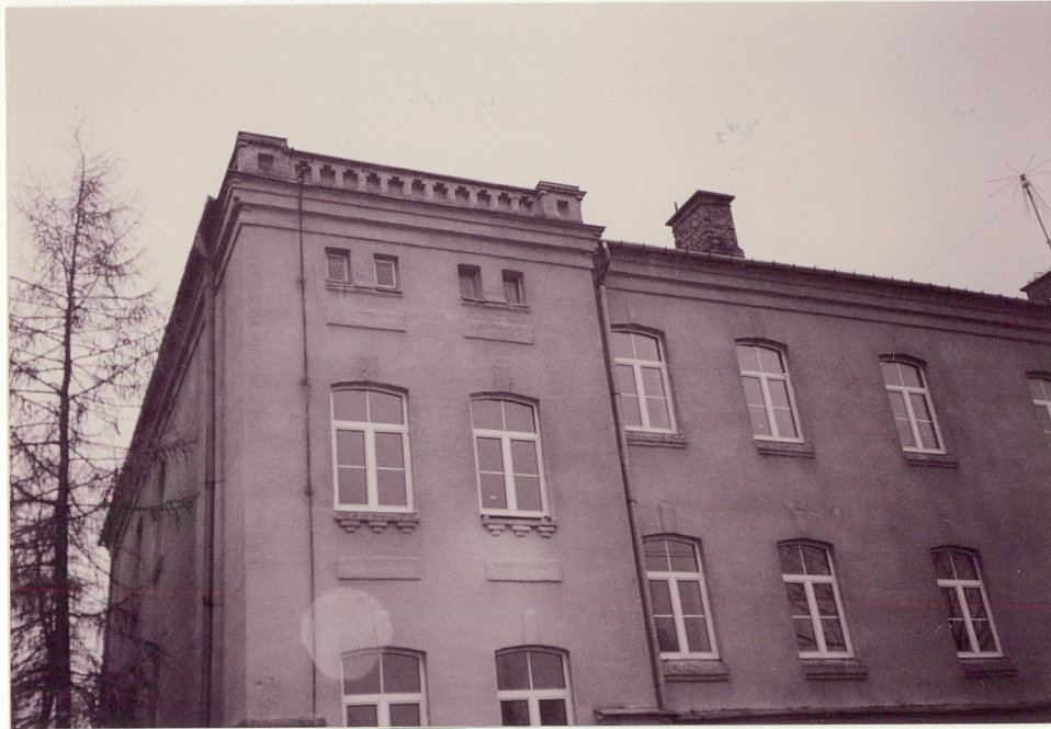
SKRZYDŁO POŁUDNIOWE - WIDOK OD ZACHODU