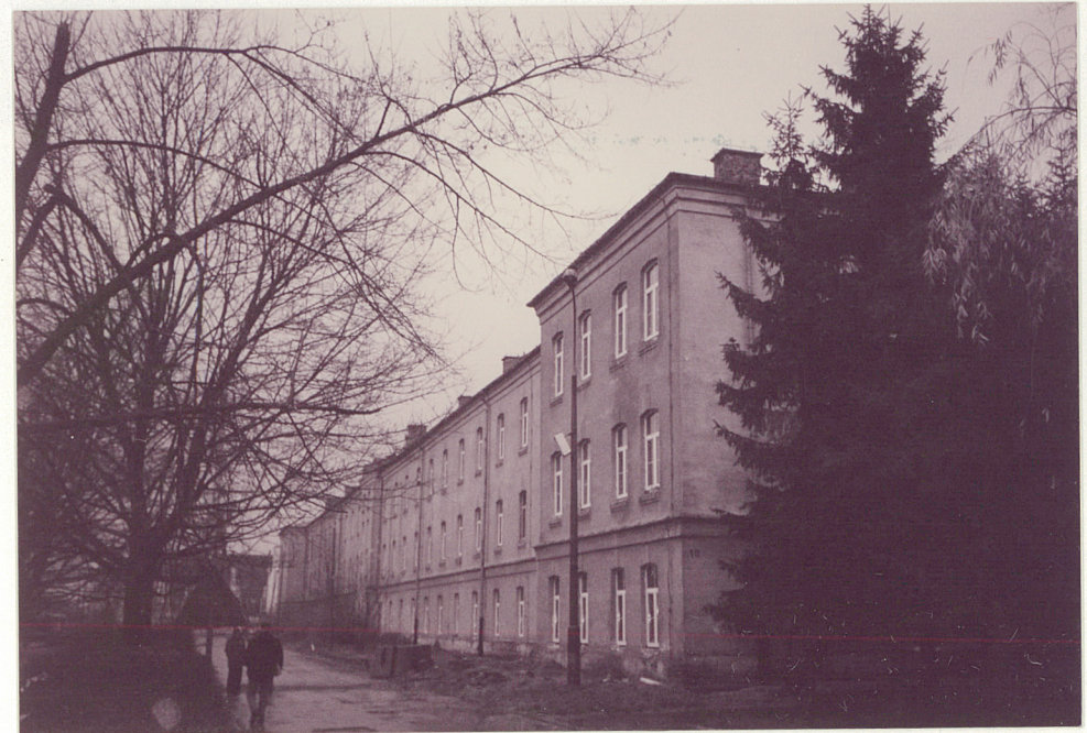
SKRZYDŁO POŁUDNIOWE - WIDOK OD WSCHODU

Wkładkę założył: mgr inż. arch. Zygmunt Płochocki 30.10.1996 r.