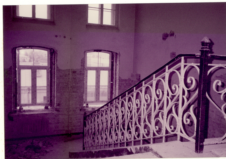
KLATKA SCHODOWA - WIDOK Z II PIĘTRA

Wkładkę założył: mgr inż. arch. Zygmunt Płochocki 30.10.1996 r.