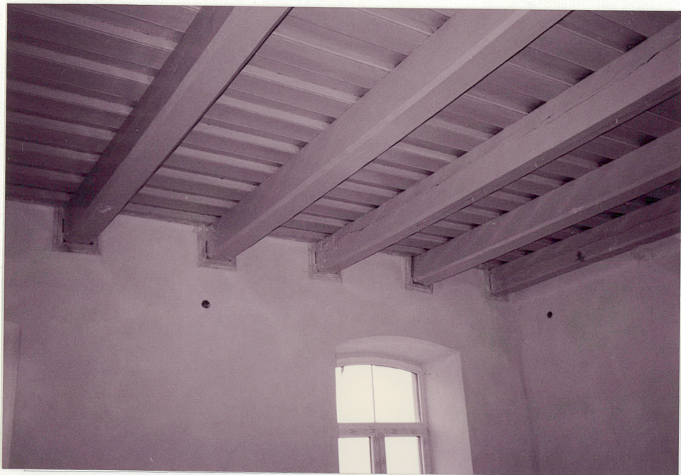
STROP W SALI ŻOŁNIERSKIEJ