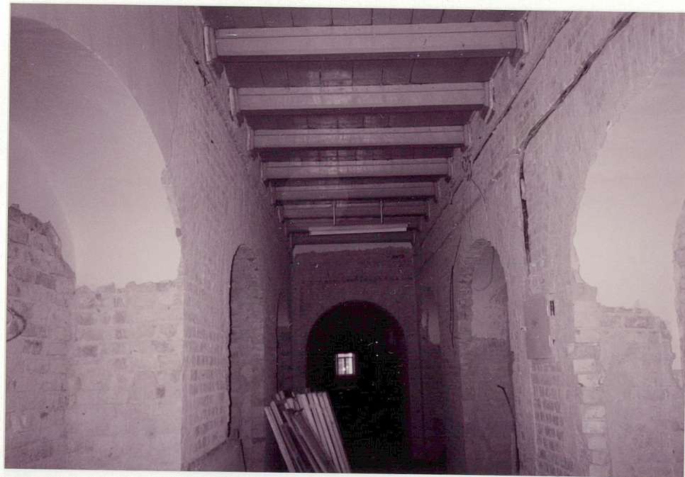
STROP W KORYTARZU