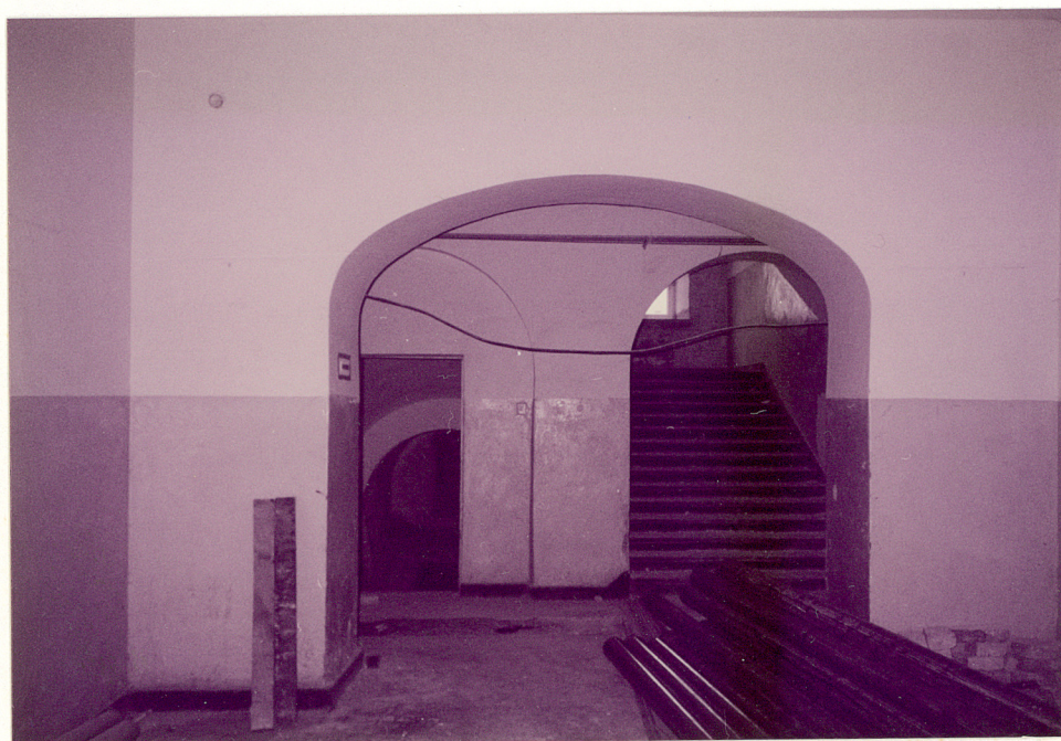
WIDOK NA KLATKĘ SCHODOWĄ OD WEJŚCIA GŁÓWNEGO