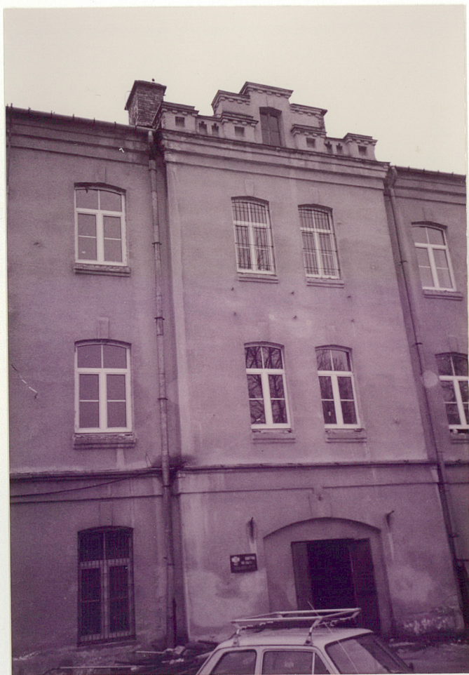
ELEWACJA WSCHODNIA - RYZALIT WEJŚCIA