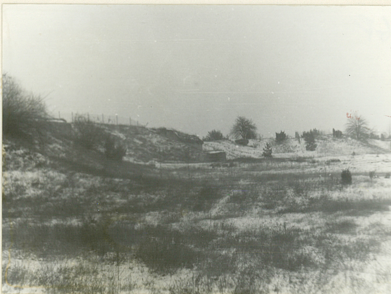
WĄZ ŁOZOWY FORTU XIV. WIDOK OD ZACHODU