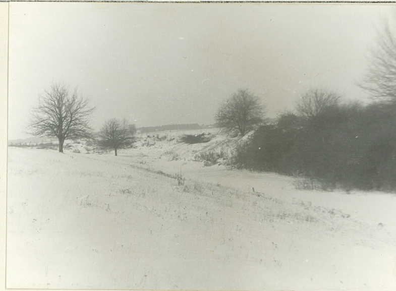
WIDOK WSCHODNIEGO SKRZYDŁA FORTU XIVB OD SZY

Wkładkę założył: mgr Andrzej Stepień XII 1985