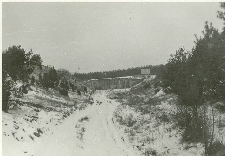
WIDOK NA KAPONIERE FORTU XIVA OD POŁUDNIOWEGO-WSCHODU