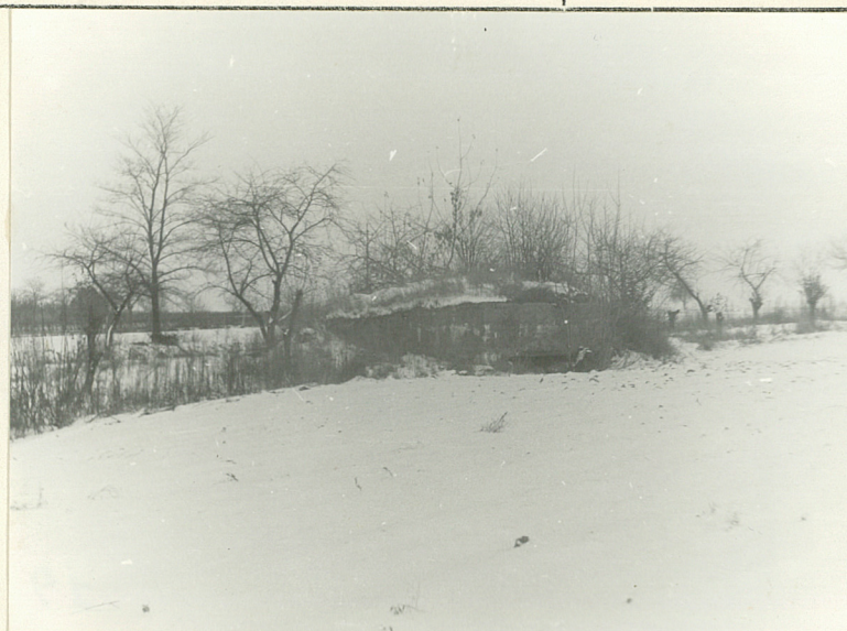
KRYTE STANOWISKO DLA KARABINÓW MASZYNOWYCH. WIDOK OD POŁUDNIOWEGO-ZACHODU