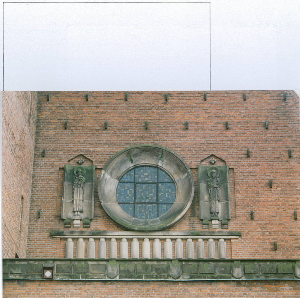
9. Okno fasady.