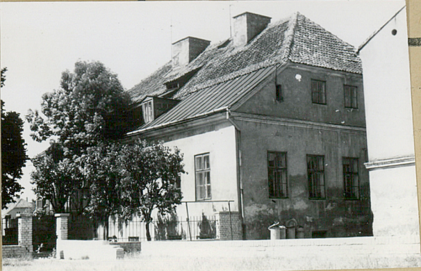
7 - 12000 - kart.