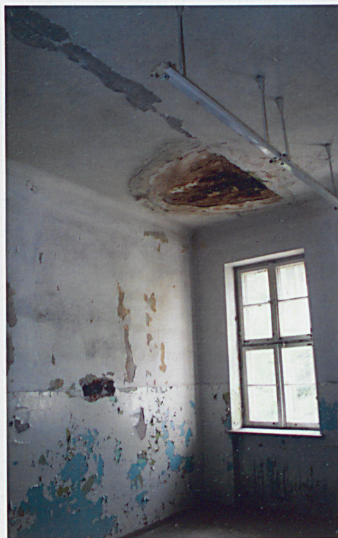
Destrukcja tynków stropu najwyższej kondygnacji