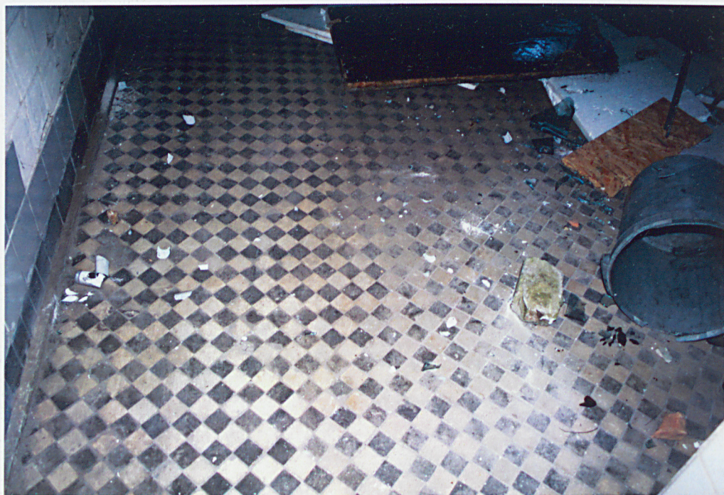
Zachowana posadzka ceramiczna w piwnicy