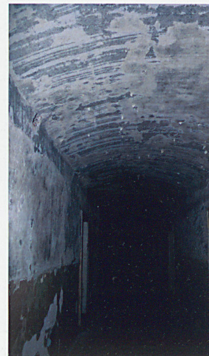
Sklepienie odcinkowe w piwnicy