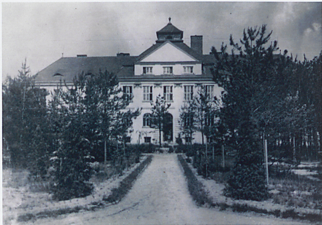
nie datowana fotografia