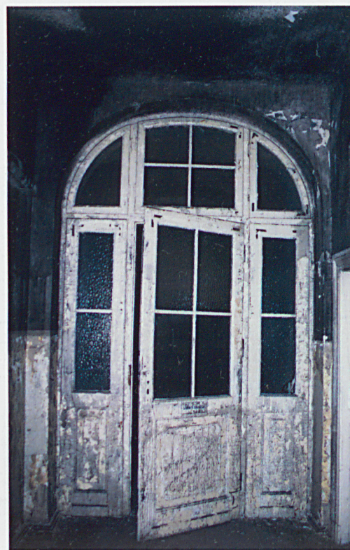
Oryginalne drzwi wewnętrzne