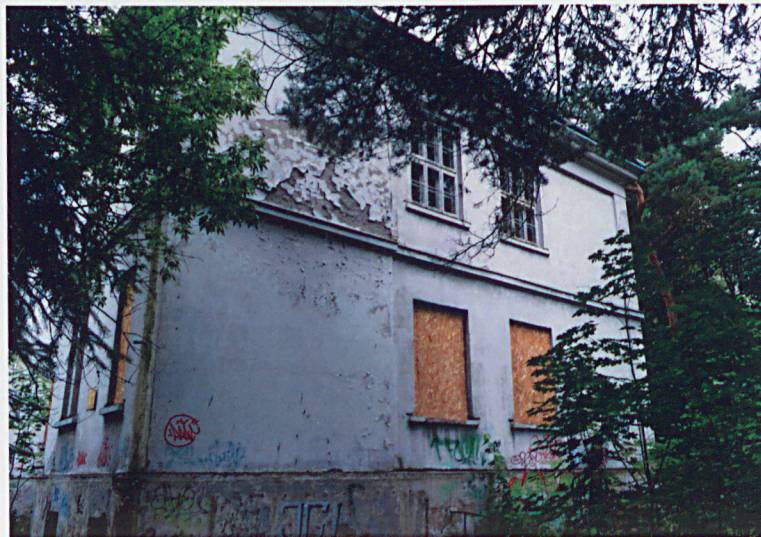
3. Narożnik południowy budynku