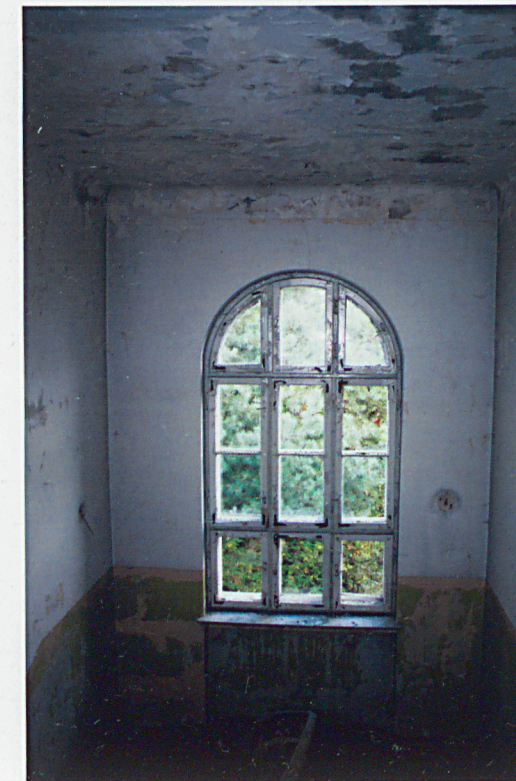
Okno klatki schodowej