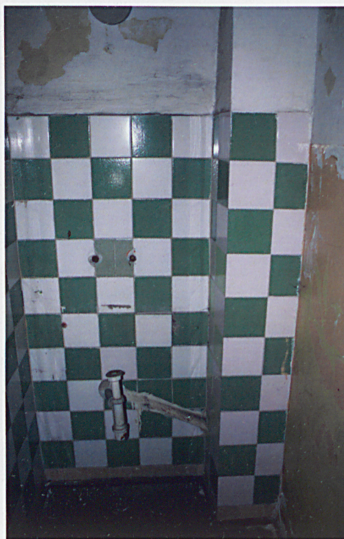
Wtórne kafelki w łazience na parterze