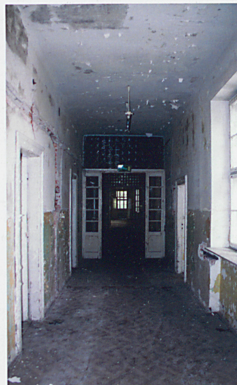
Korytarz na piętrze