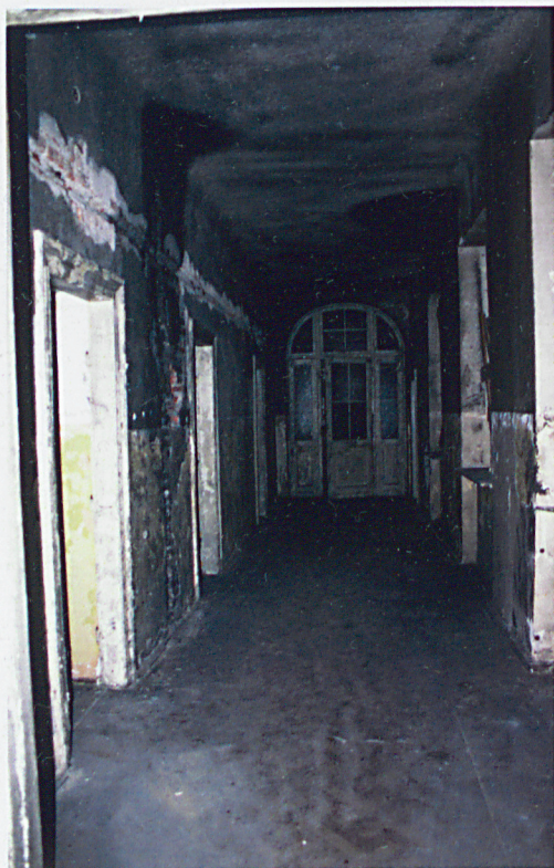
Widok korytarza na parterze