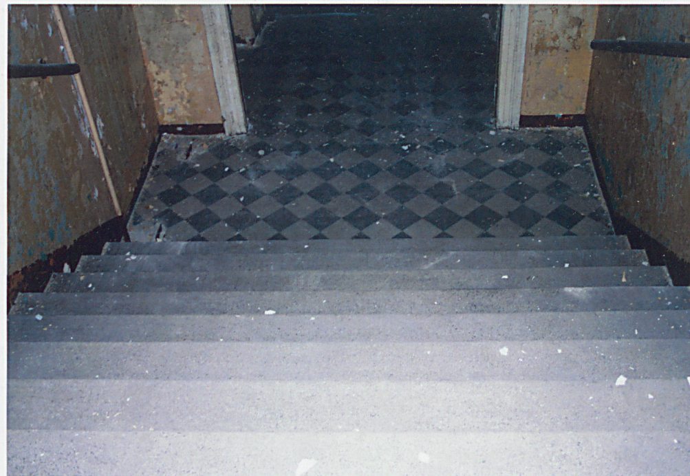
Przedśionek wejścia głównego