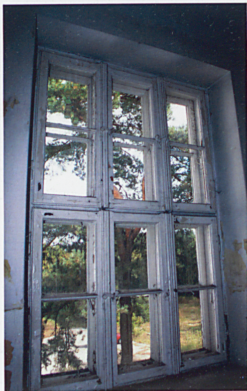
Oryginalne okno na piętrze