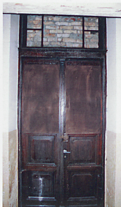
Oryginalne drzwi wejściowe