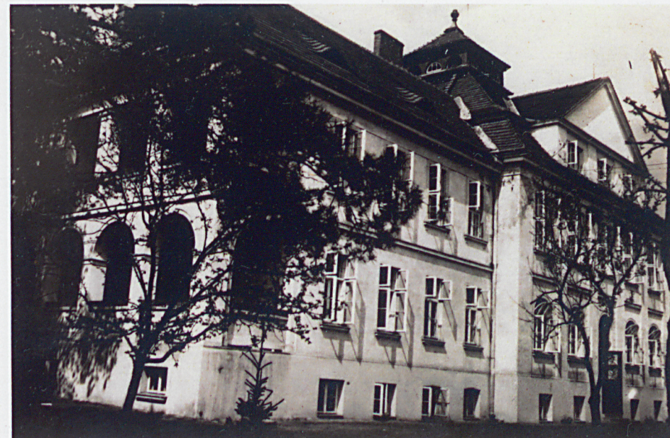
fotografia archiwalna z 1925 r. (dokumentująca stan sprzed zabudowy loggii)