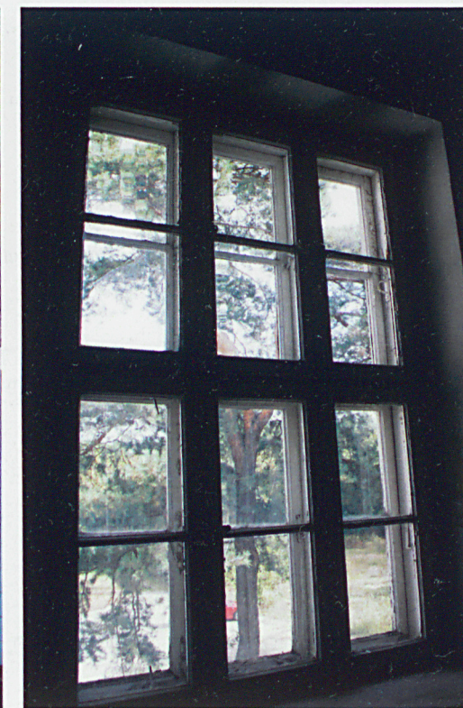
Zachowane wielopolowe okno