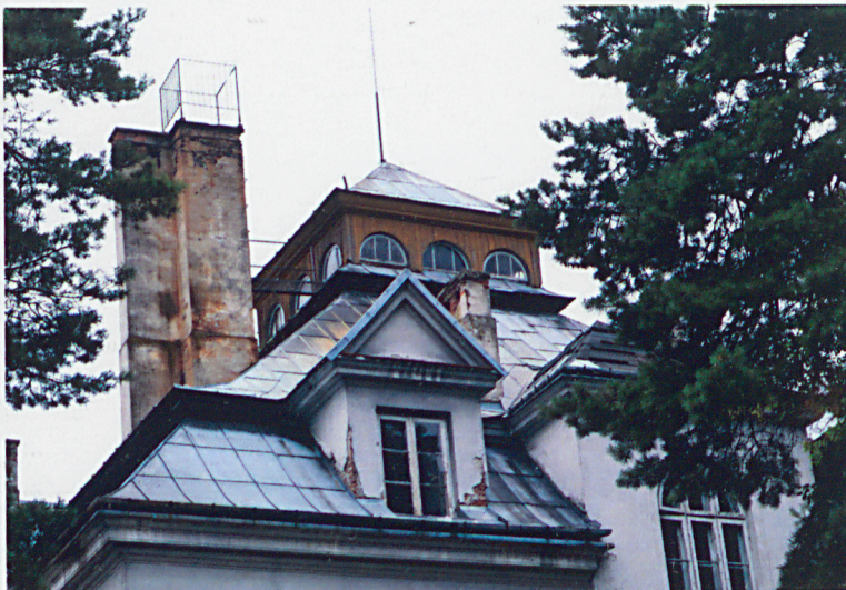
1. Elewacja frontowa (północno-wschodnia)