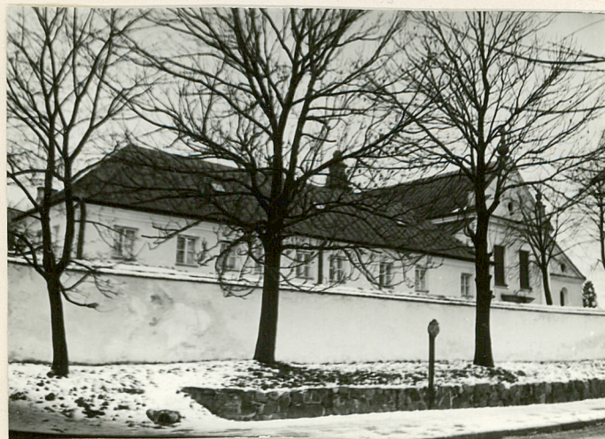
data wykonania XII 1983 miejsce przechowywania negatywów