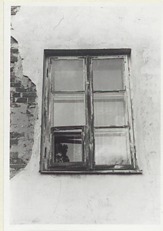
4. Okno w oficynie

Wkładkę założył: Bonusiak, Pietrzak XII 1991 r (imię, nazwisko, data)