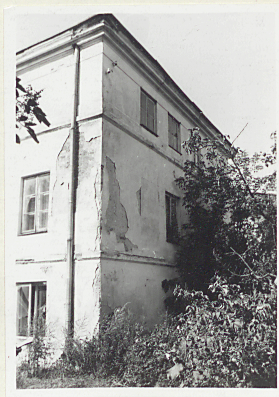
3. Naróżnik pół - wsch