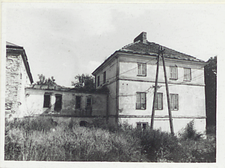
2. Elewacja zach, oficyna i łącznik

ELEWACJE ŁĄCZNIKA : zach i wsch jednakowe, na poziomie parteru 4-osiowe z otworami zgrupowanymi w dwie pary. Na poziomie piwnic łącznik wsparty na dwóch półokrągłych arkadach. Dach siodłowy, kryty papą. Prostokątne otwory okienne, częściowo pozbawione stolarki, brak skrzydeł.