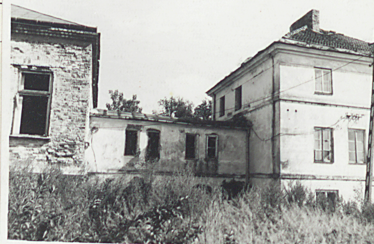
6. Elewacja zach. dwór - Tęczańska - oficyna