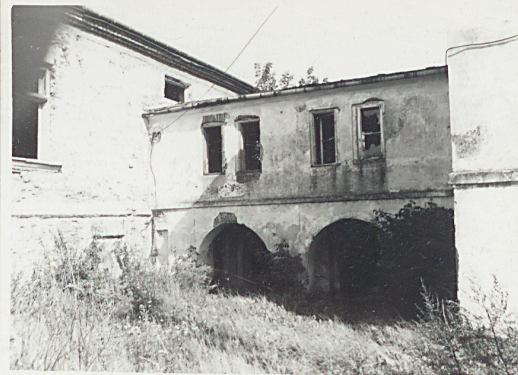
5. Elewacja zach. Tęczańska.