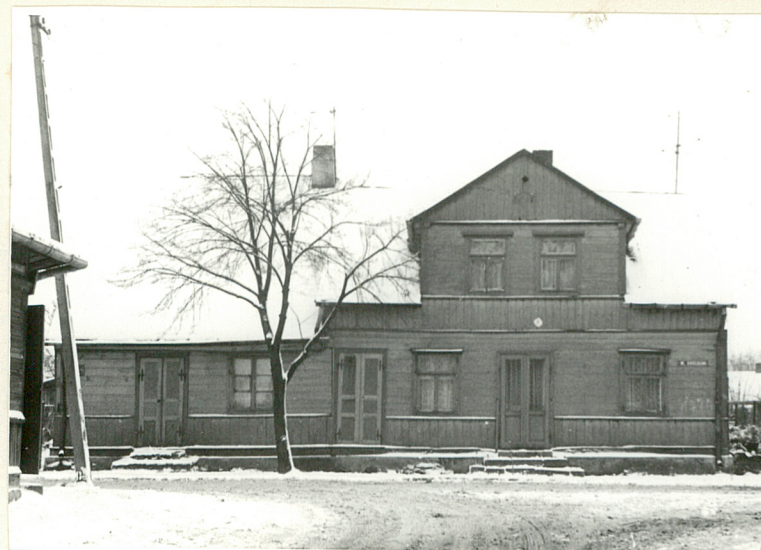
1. Elewacja północna