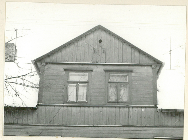
7. Elew. płn - facjata