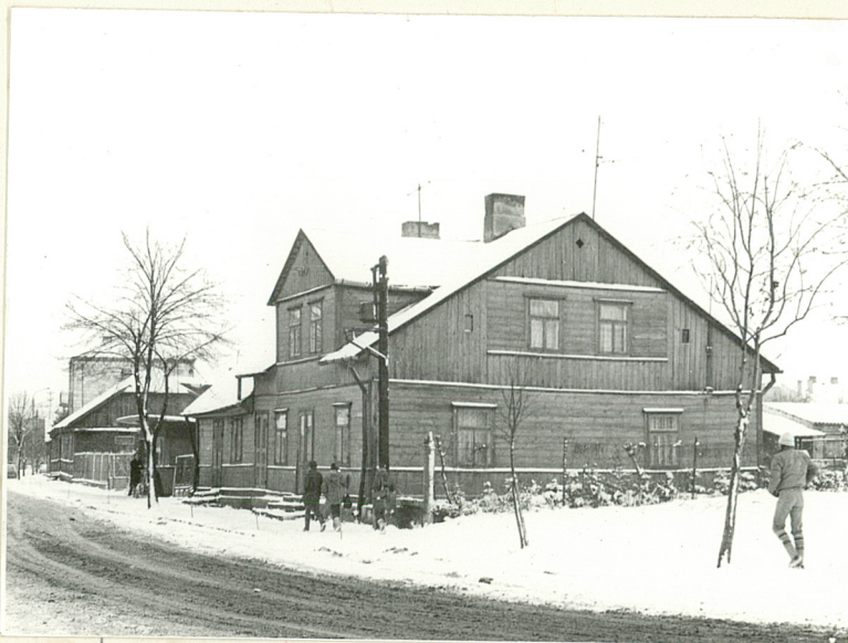
3. Elewacja zachodnia