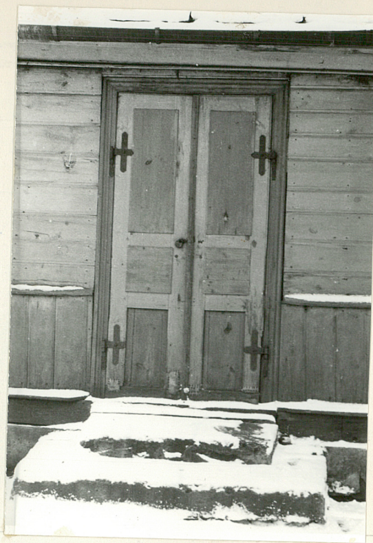
6. Elew. płn drzwi