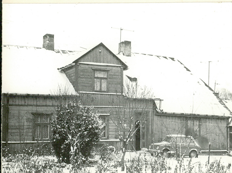
2. Elewacja południowa