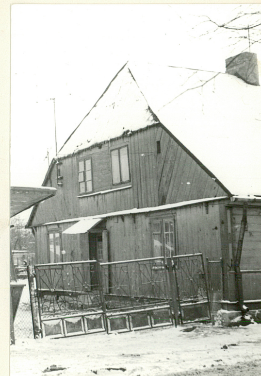
4. Elewacja wschodnia