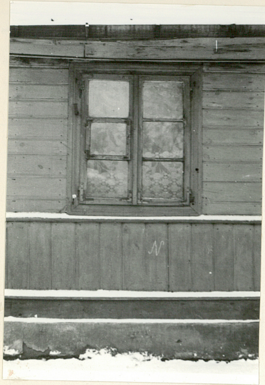
5. Elew. płn - okno