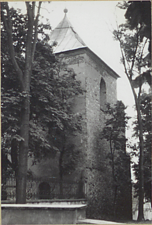
32. Przebieg prac konserwatorskich