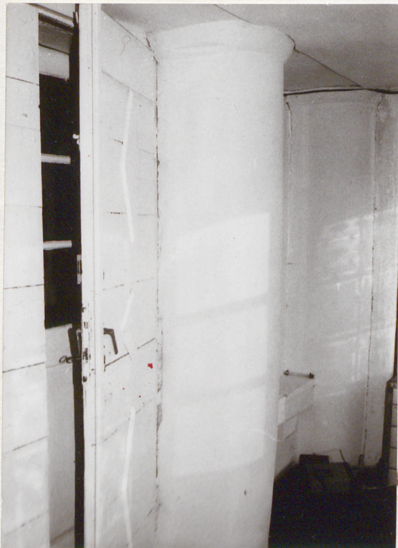
Półkolumnienki w ganku pld.