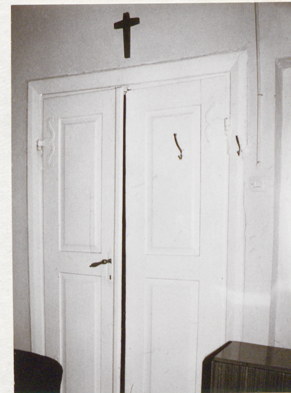
Drzwi do pokoju pld-wsch.