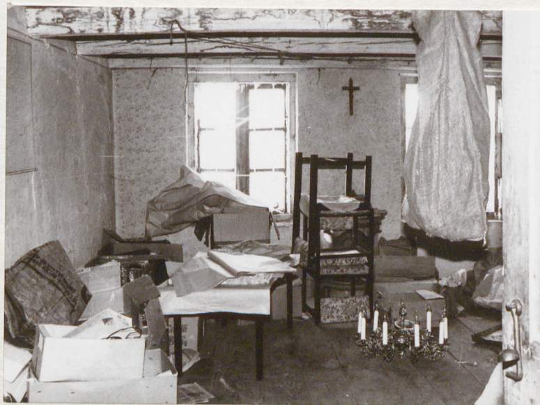
Wnętrze pokoju na poddaszu