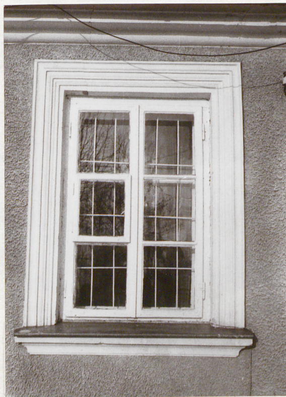
Okno w elewacji pld.