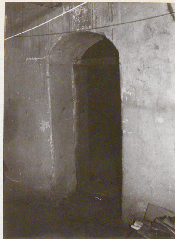
Przejście między kominami