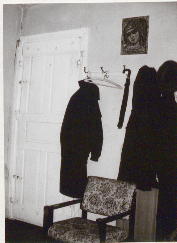
Drzwi w sieni prowadzące na strych