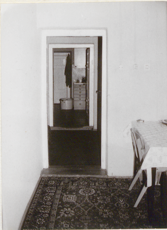
Ciąg komunikacyjny widok kuchni i komory