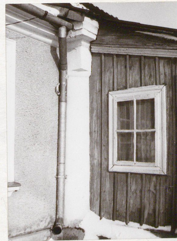
Okno w ścianie zach.ganku pld.