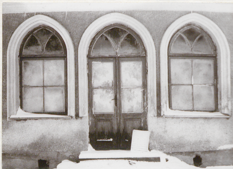
Okna i drzwi w elewacji płn.