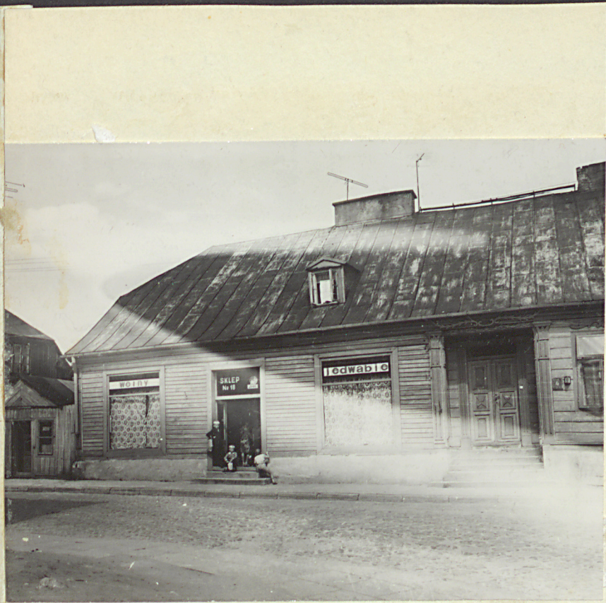
Sierpiec, Pontyżantów 4

36. Wypełnił dnia A. Lorenc 1975 r. 37. Sprawdził dnia