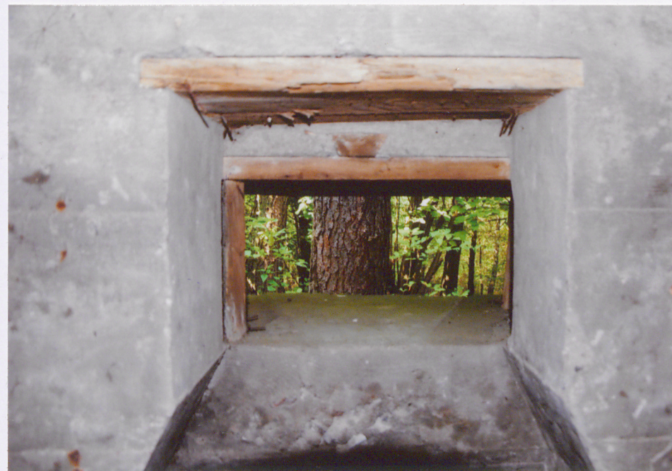
(foto. 10) ściana wewnętrzna elewacji zachodniej - bocznej, otwór strzelniczy, pozostałości oszalowań