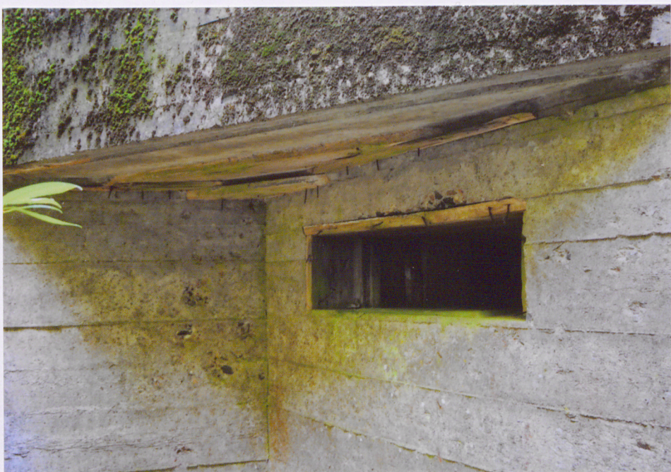
(foto. 5) elewacja wschodnia – boczna, otwór strzelniczy, pozostałości drewnianego