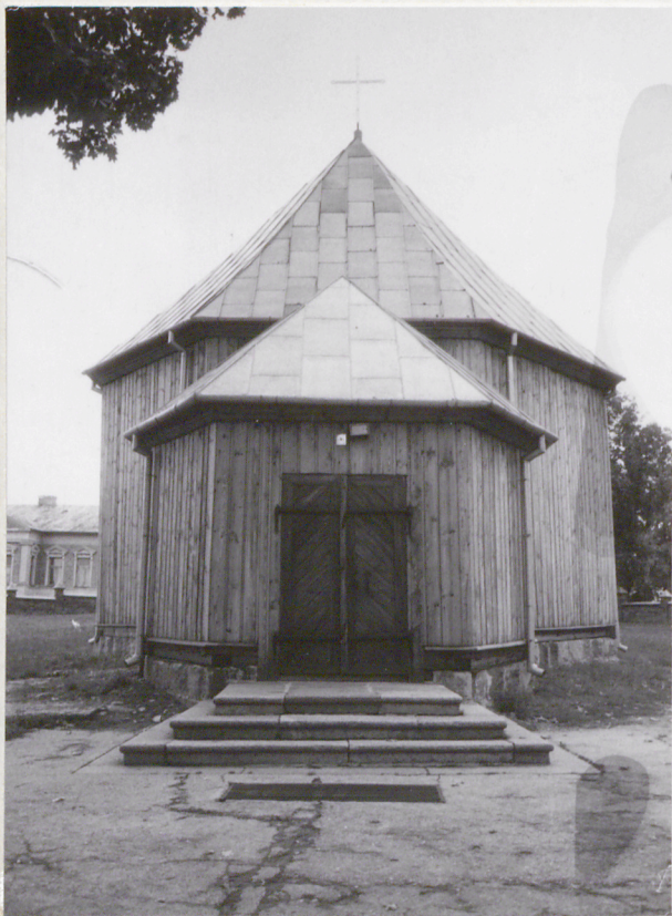
6. Elewacja zachodnia.