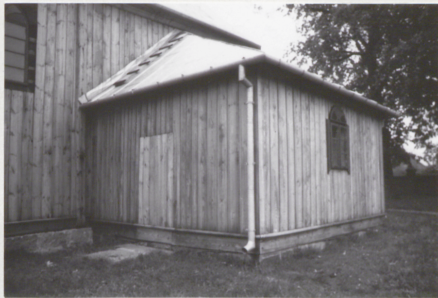
7. Zakrycia południowa.