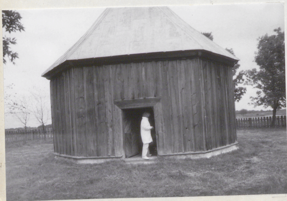
2. Elewacja południowa