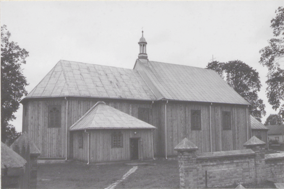
4. Elewacja południowa.