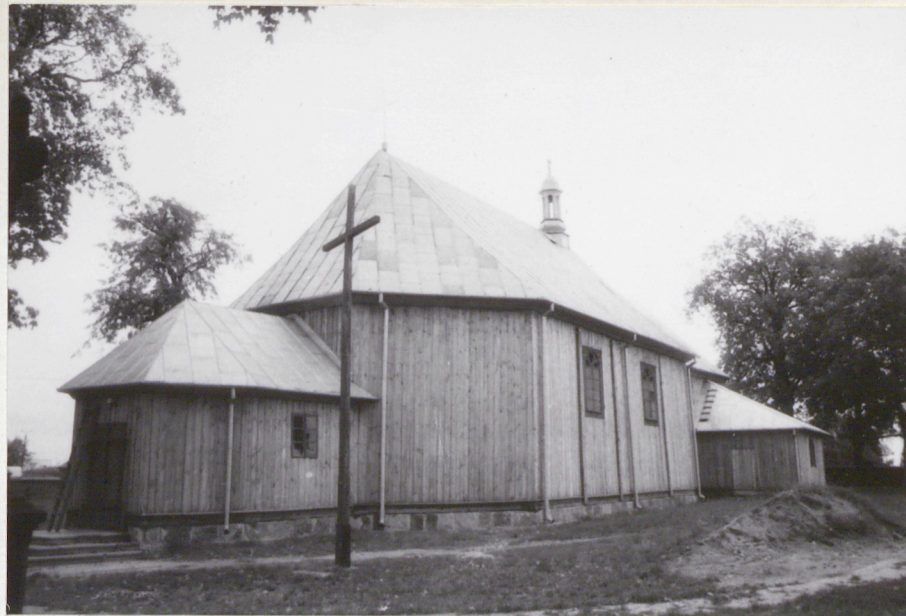
5. Elewacja północna.