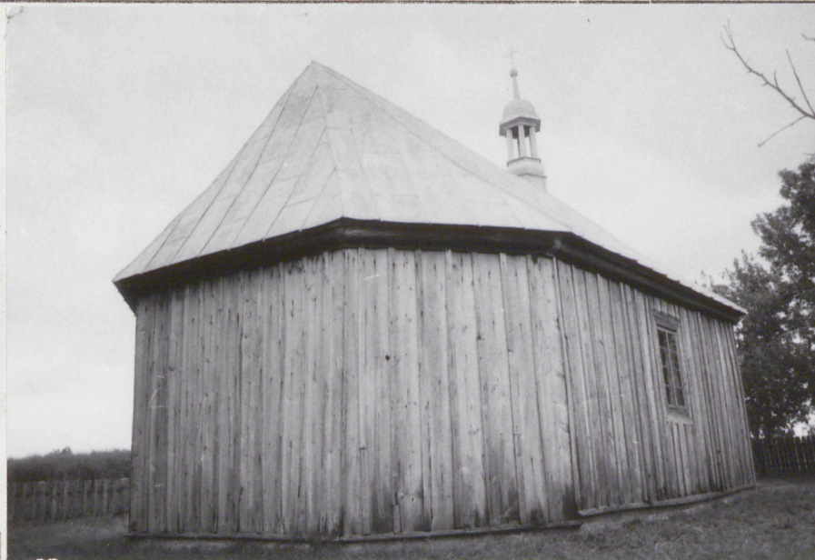
1. Widok od północy