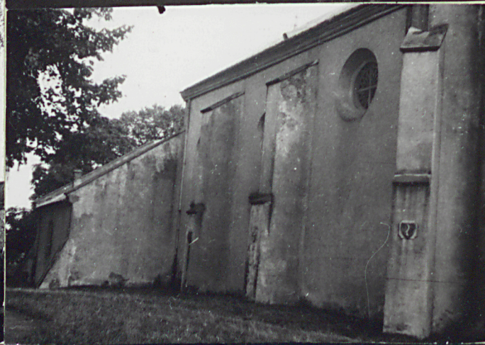
36. Wypełnił dnia