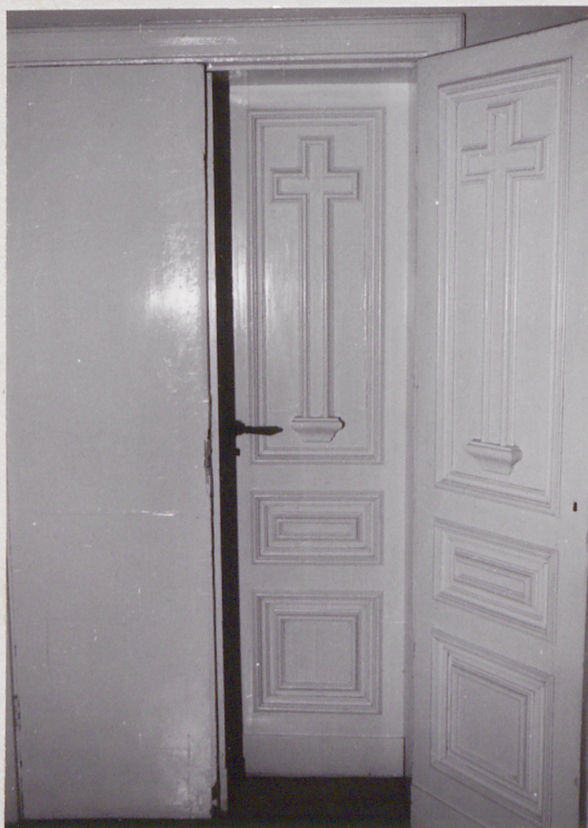
fot.27 drzwi do kaplicy