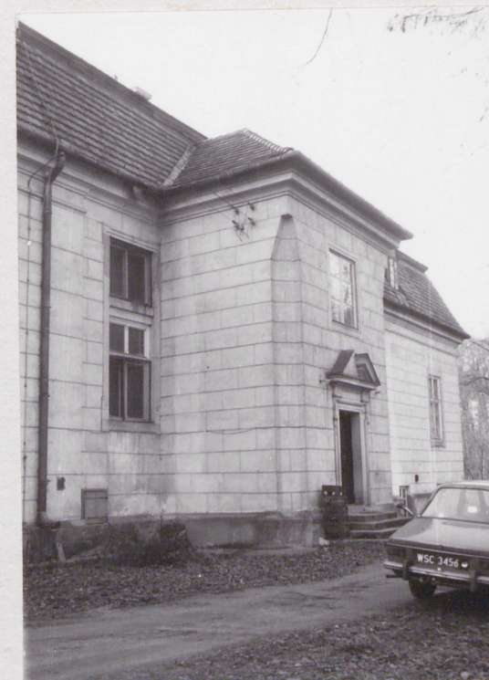
fot.17 ryzalit w elewacji tylnej.