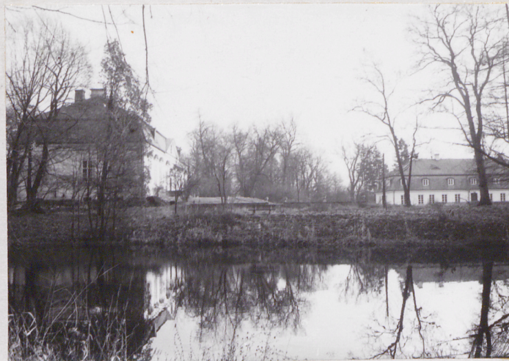
fot.3 dwór i oficyna od zach.