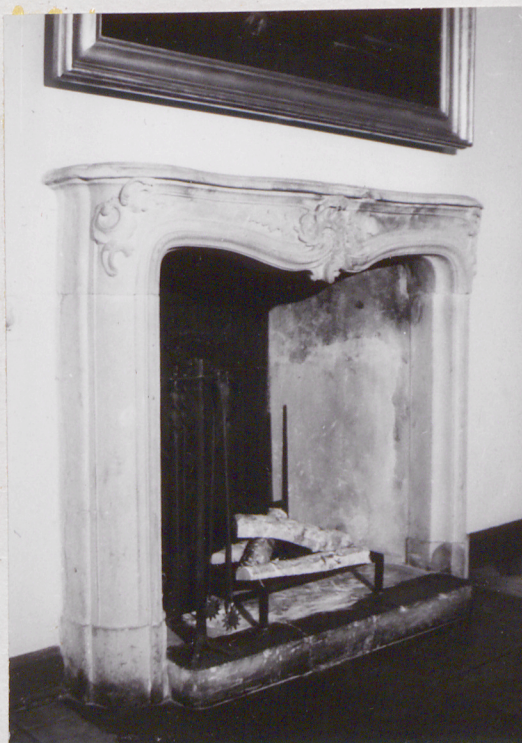
fot.25 kominek w pomieszczeniu połudn. traktu frontowego