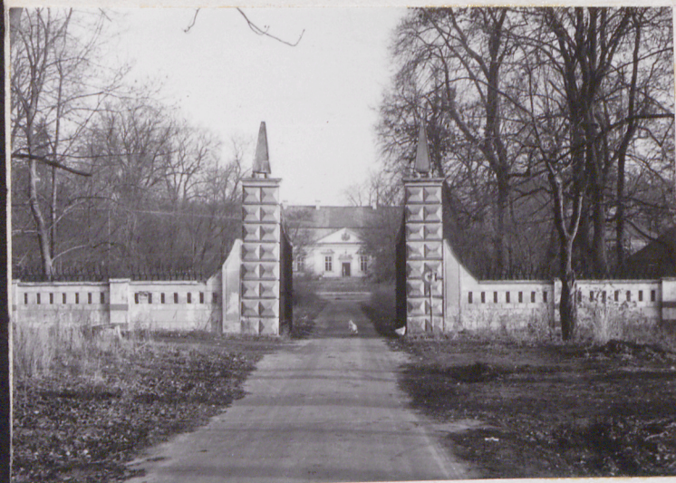
fot.2 widok przez bramę wjazdową