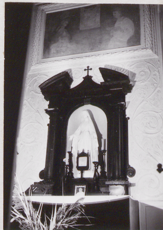
fot.29 ołtarz w kaplicy