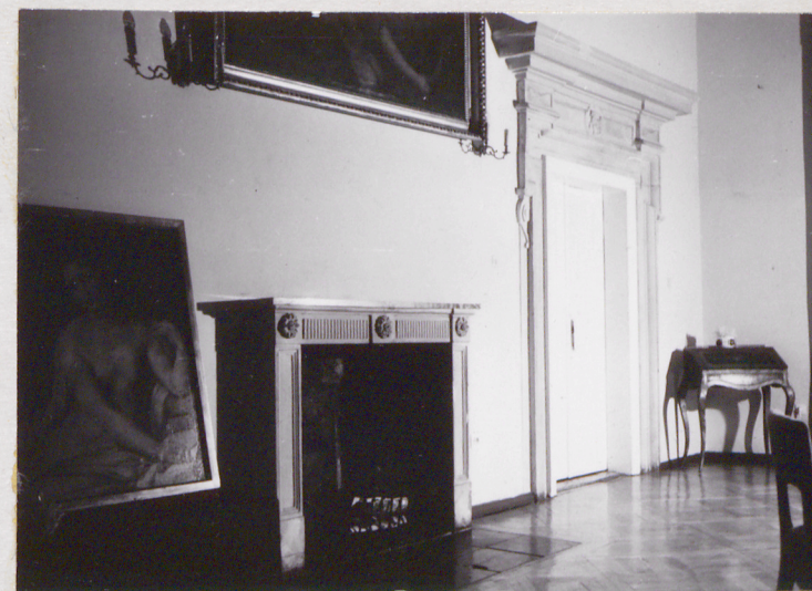
fot.26 kominek i portal w 2. od pld. pomieszczeniu traktu tylnego.