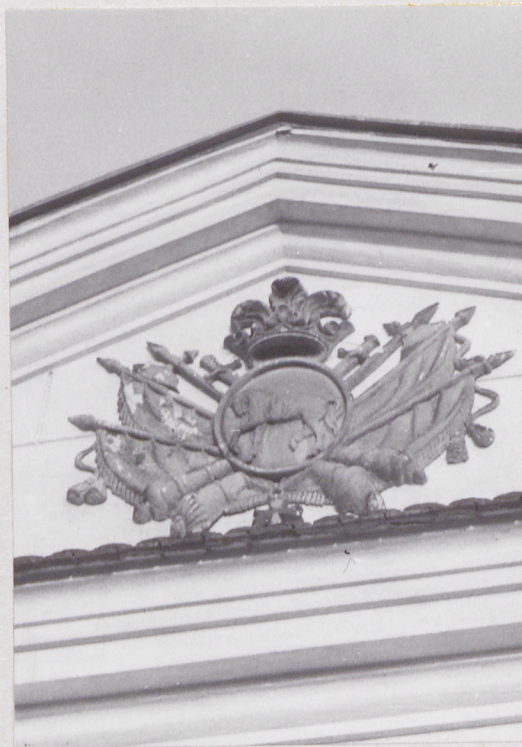
fot.16 tympanon nad elew. frontową