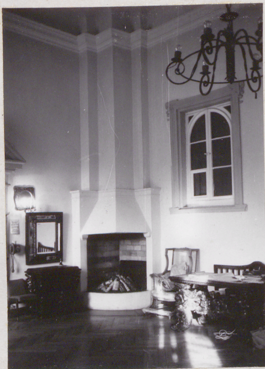
fot.24 wnętrze sieni