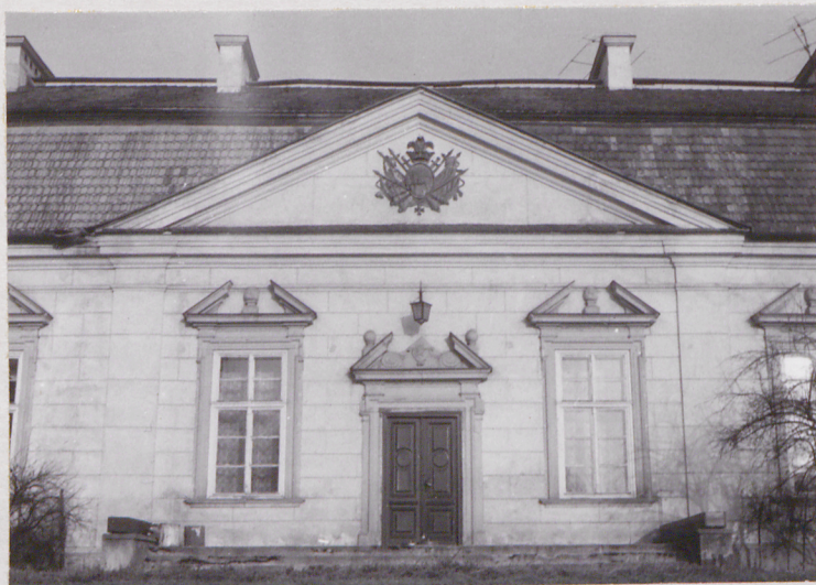
fot.15 fragment środkowy elewacji frontowej