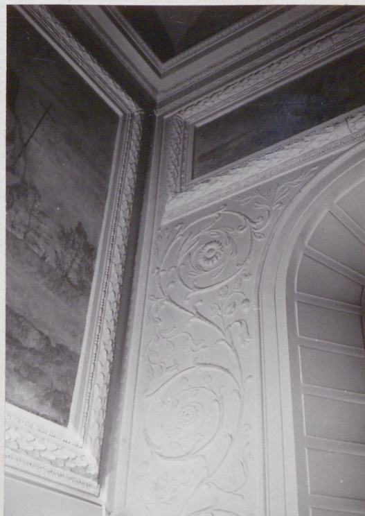
fot.28 fragment dekoracji kaplicy