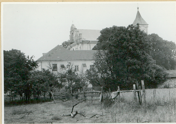
Zespół od poł.