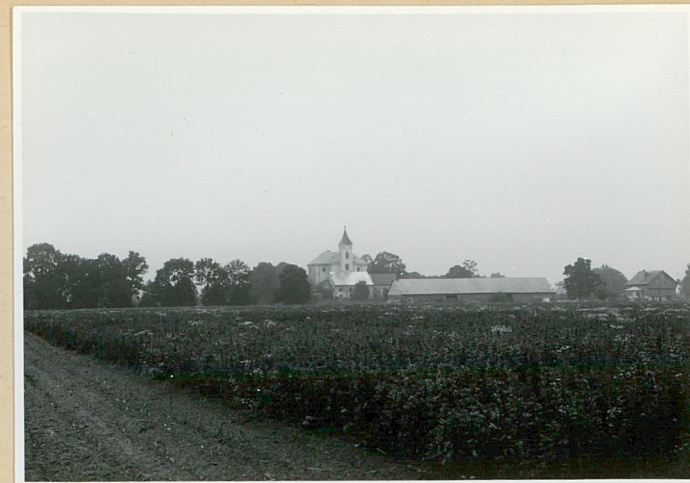
Zespół od wsch.