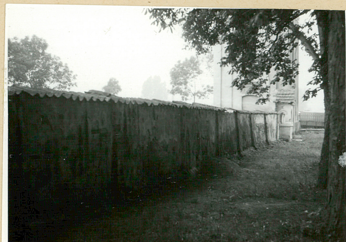
Mur przy dziedzińcu