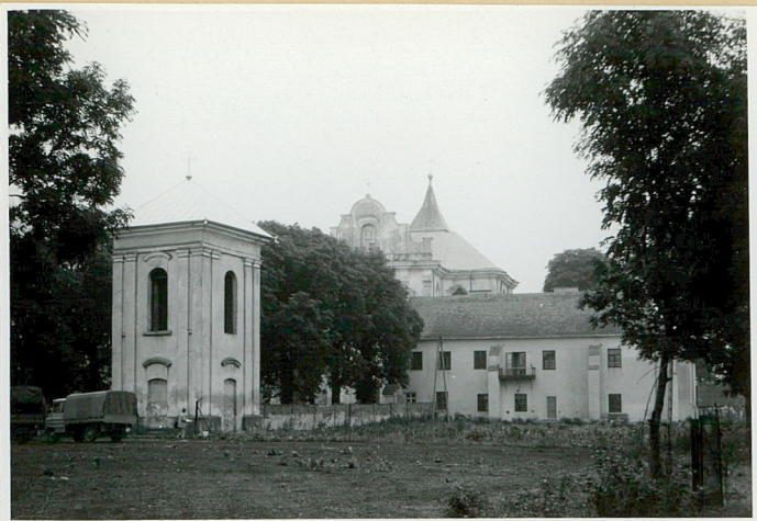
Zespół od zach.