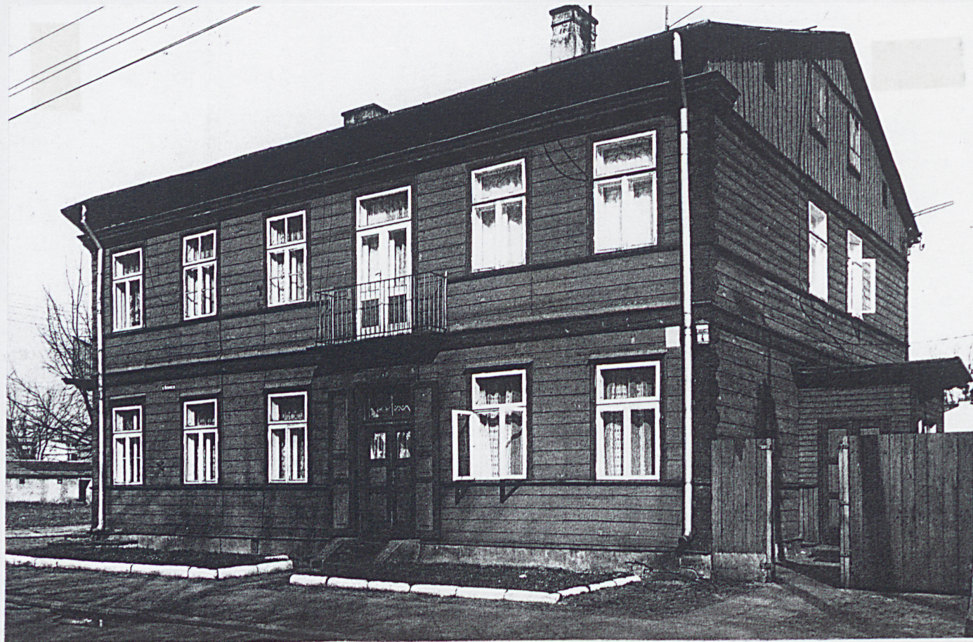
FOT. 2. Nowy Dwór Maz. ul. Wybickiego 4. Widok elewacji zachodniej, stan 1978.

6. Zawartość wkładki (nazwa materiału uzupełniającego) FOTOGRAFIE