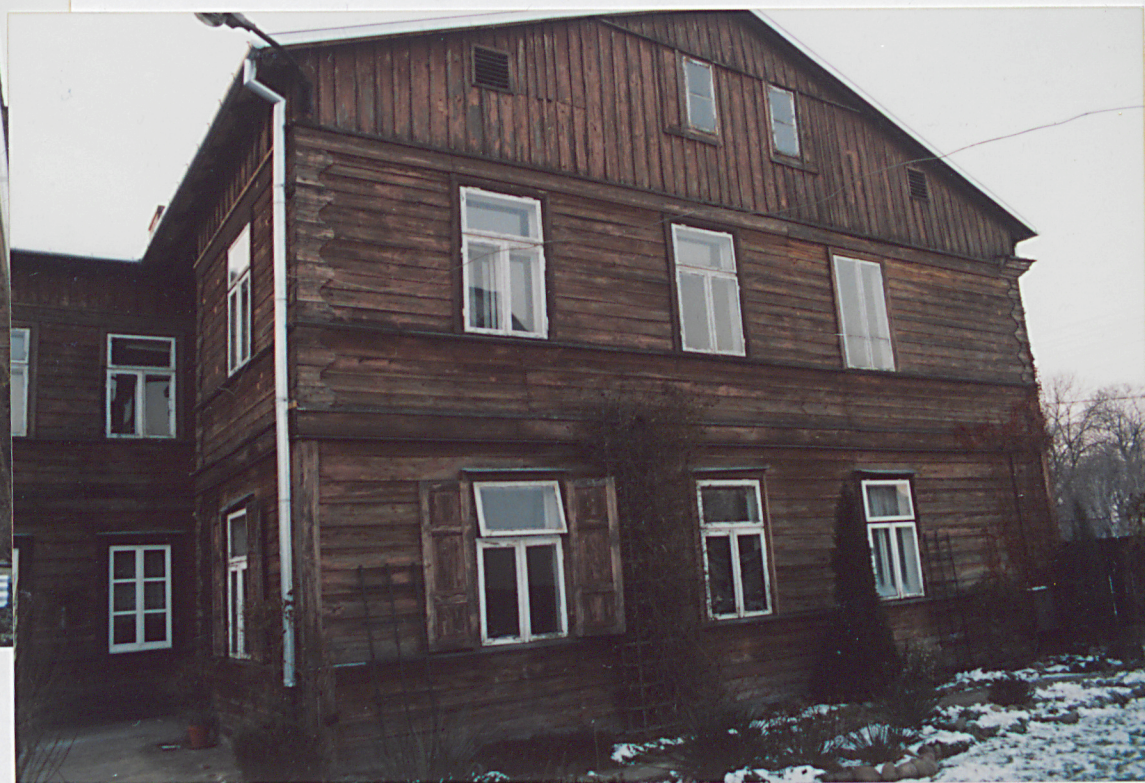
FOT. 5. Nowy Dwór Maz. ul. Wybickiego 4, Widok elewacji południowej, stan grudzień 2001.