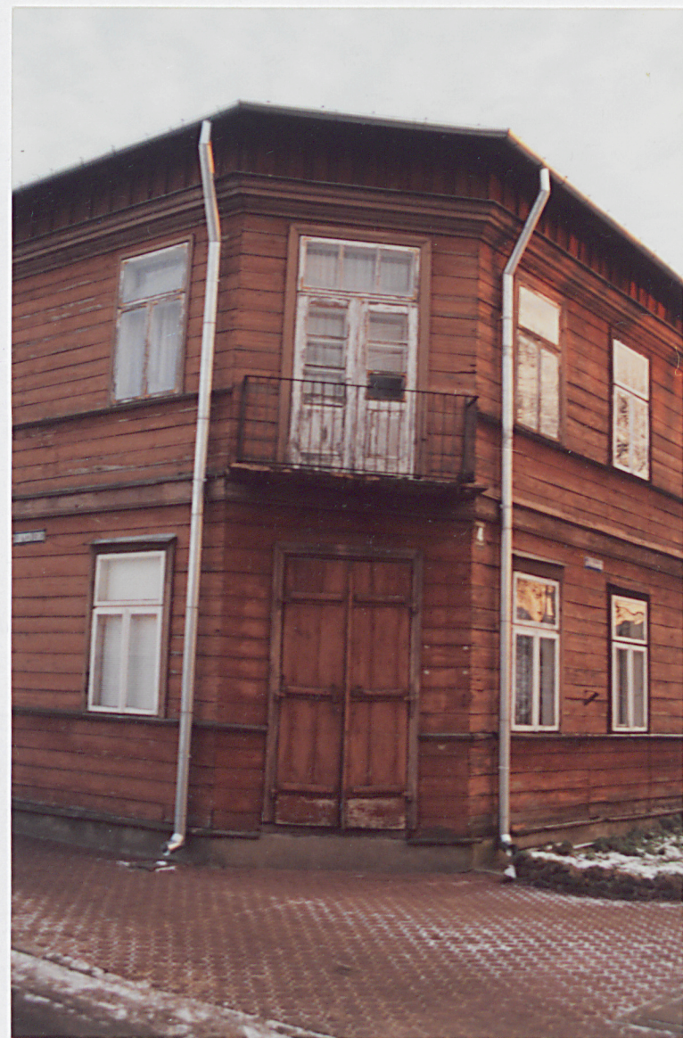
FOT. 3. Nowy Dwór Maz. ul. Wybickiego 4, Widok elewacji zachodniej, stan grudzień 2001. FOT. 4 Nowy Dwór Maz. ul. Wybickiego 4, Północny narożnik budynku, stan grudzień 2001.