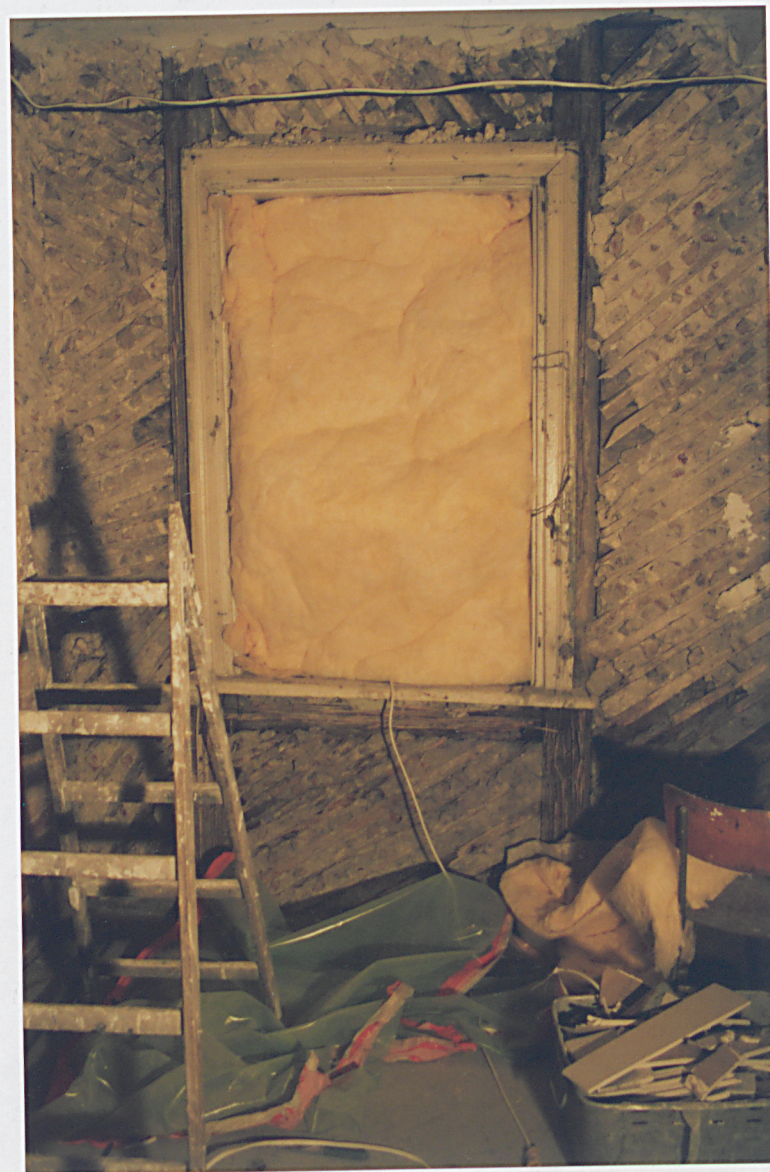
FOT. 7. Nowy Dwór Maz. ul. Wybickiego 4, Widok elewacji południowej, stan grudzień 2001.