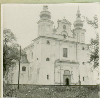
TZG Chełmno — Nr 495 9. 50 40.000 B-119479