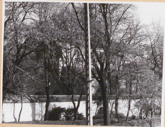
widok na zespół od pd.