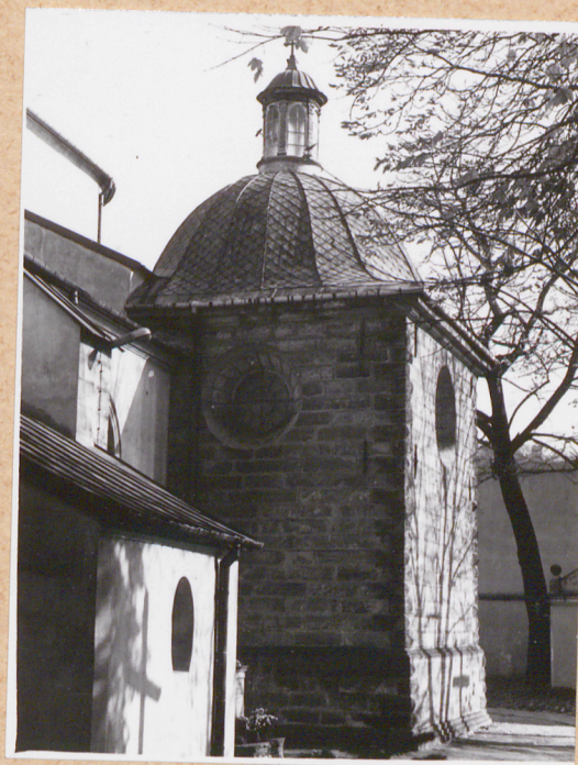
kaplica od pd.