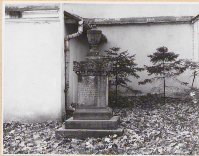
nagrobek na d.cmentarzu przykościel.