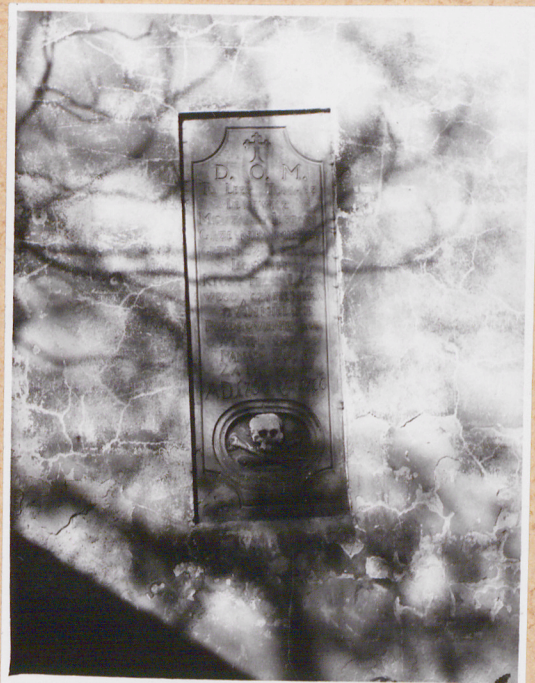
płyta nagrobna w prezbiterium