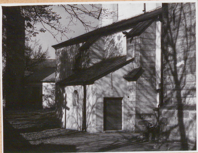
zakrystia od pd.wsch.