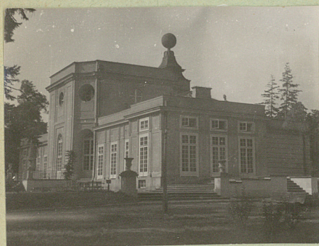
Foto zony w parku krajostrawym jako os' rozległego zatoczenia patacowego. murawiany, luskawiany, podpiwnicowy, (piwnice sklepione kielbaso) w ore'sci smodkowej 2 kandyguaciowy salon. dit st. doreutr "Jabłonna" kiel. 1961