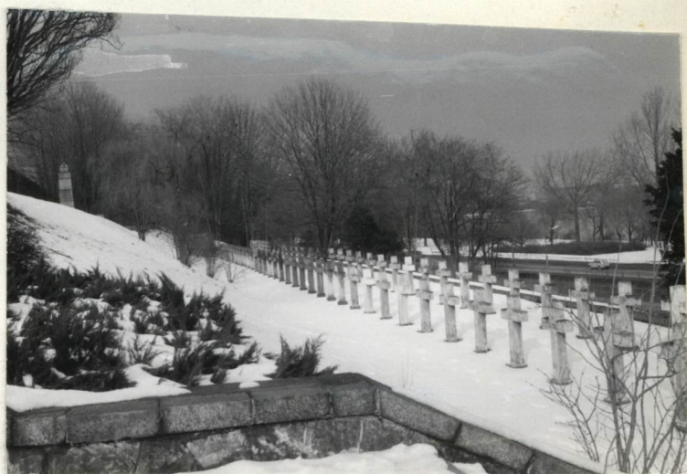
3. KRZYŻE STR. PRAWA OD BRAMY