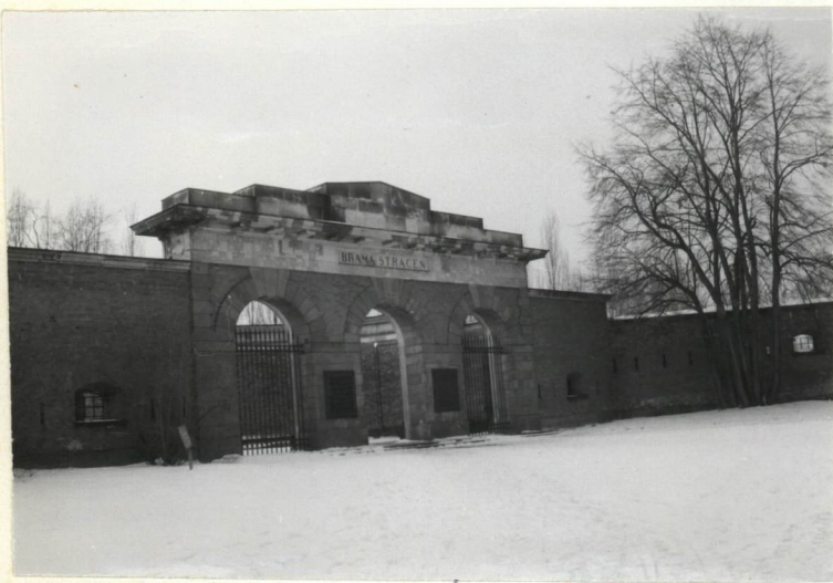
4. BRAMA STRACENI