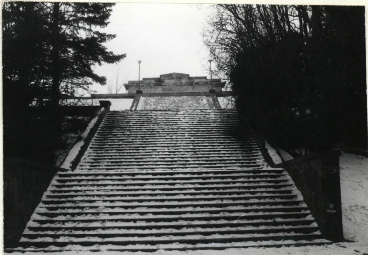
2. SCHODY DO BRAMY STRACENI