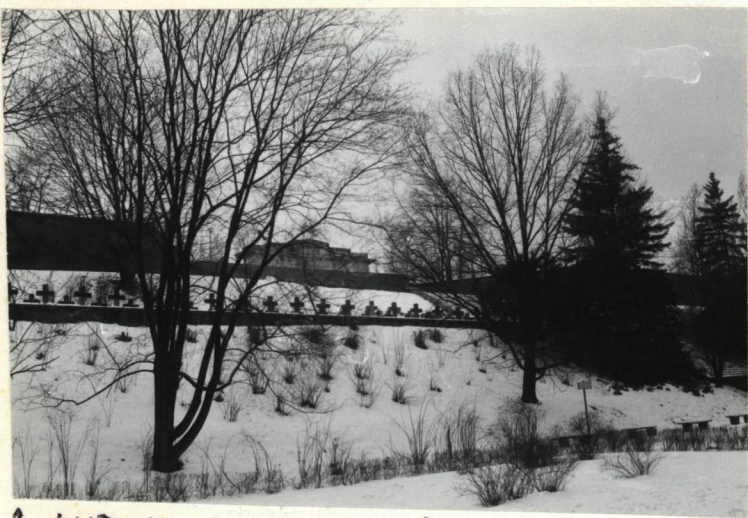
1. WIDOK Z WYBRZEŻA GDYŃSKIEGO