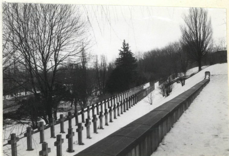
6 KRZYŻE STR. LEWA OD BRAMY