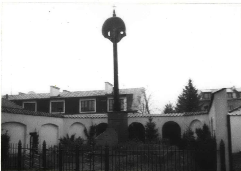
FOT. 1 WIDOK OGÓLNY NA MOGIŁĘ Z DEBOWYM KRYŻEM