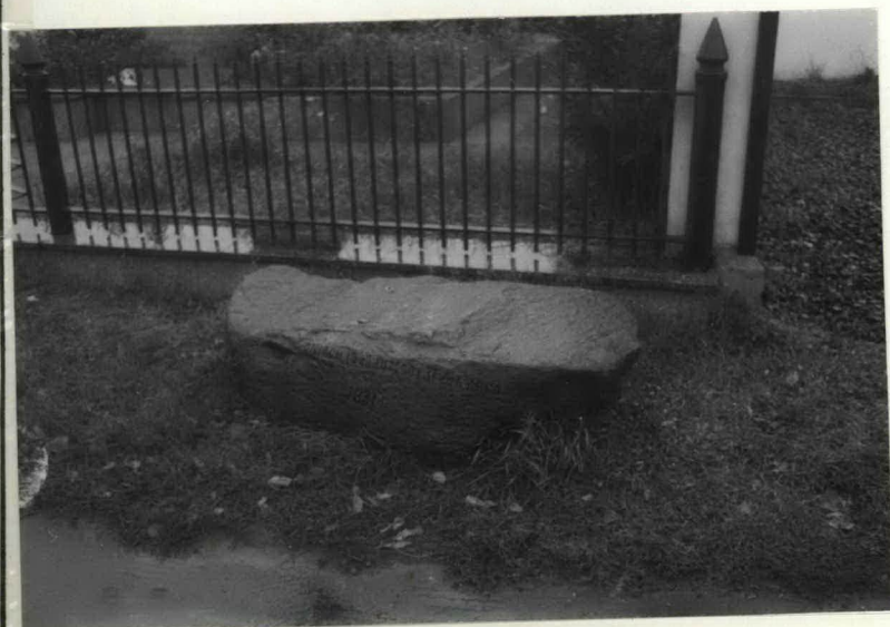
FOT. 4 GŁAZ PRZED WEJŚCIEM Z NAPISEM „W DNIACH 19-40 LUTEGO I 31-40 MARCA 1831 R