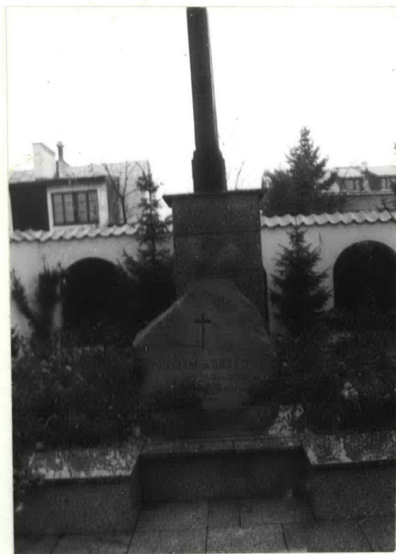
FOT. 3 KRZYŻ DĘBOWY NA COKOLE I GŁAZ Z NAPISEM „POLEGŁYM ZA OJCZYZNĘ