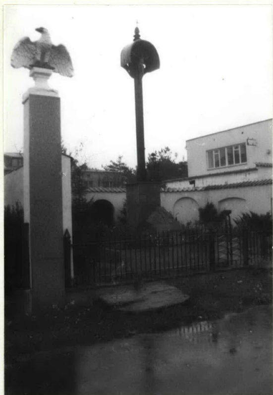
FOT. 2 WIDOK OD STRONY ZACHODNIEJ