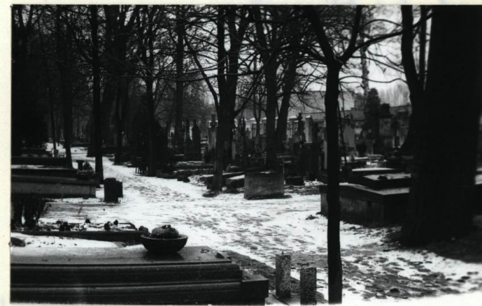
WIDOK NA REJON KWATERY.