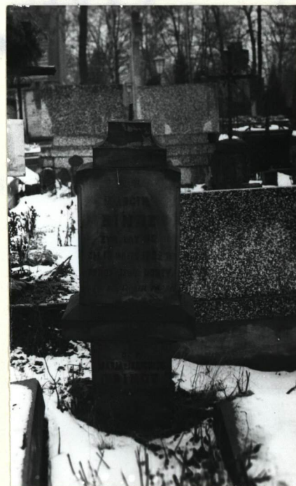
NAGROBEK Z IX. 1892 R. WSPÓŁCZESNY KWATERZE I POŁOŻONY W JEJ REJONIE.