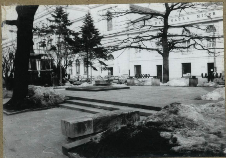
1. WIDOK OGÓLNY