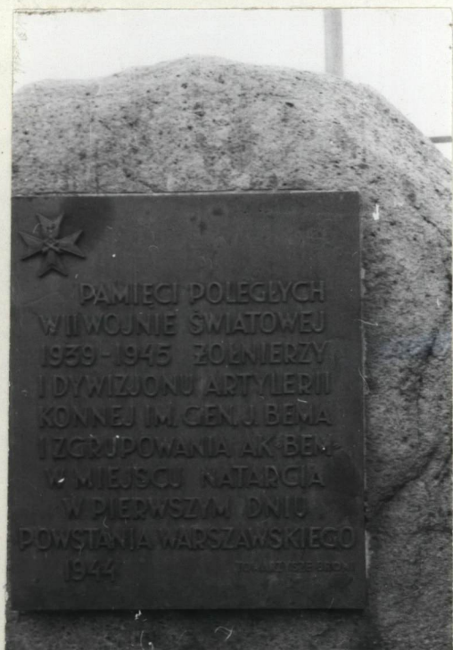
3. TABLICA NA BŁAZIE-OBELISKU