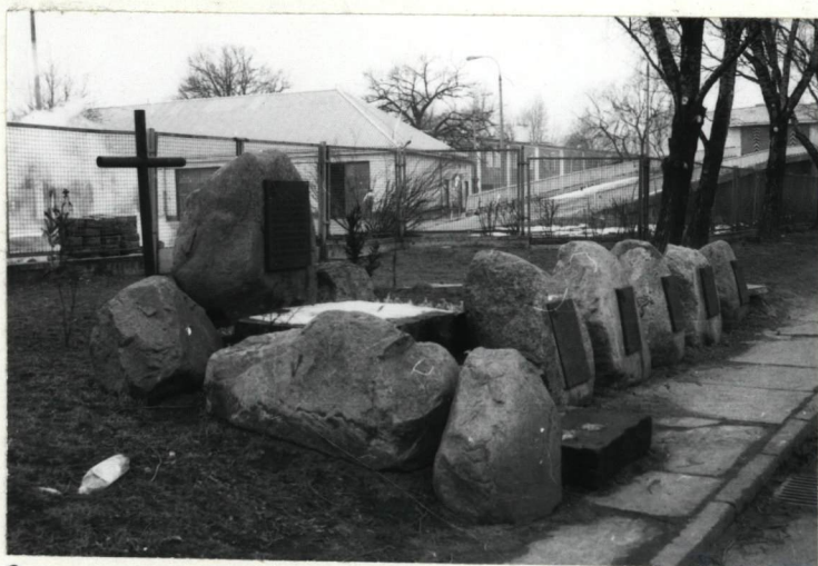
MOGIŁA - WIDOK OGÓLNY