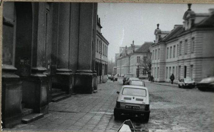
WIDOK NA TEREN CMENTARZA Z NAROZNIKA UL. ZAKROCZYMSKIEJ I UL. FRANCISZKAŃSKIEJ Z PRAWEJ PAŁAC SAPIEHÓW.