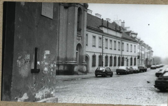
WIDOK NA TEREN CMENTARZA Z NAROZNIKA UL. FRETA I UL. FRANCISZKAŃSKIEJ Z LEWEJ KOŚCIÓŁ I KLASZTOR FRANCISZKANÓW