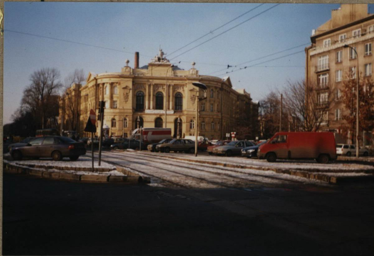
5. GMACH GŁÓWNY POLITECHNIKI WARSZAWSKIEJ