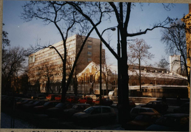
2. WIDOK NA GMACHY POLITECHNIKI OD UL. NOWOWIEJSKIEJ