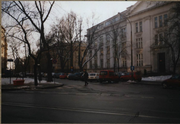
3. WIDOK NA GMACHY POLITECHNIKI OD STRONY UL. KOSZYKOWEJ