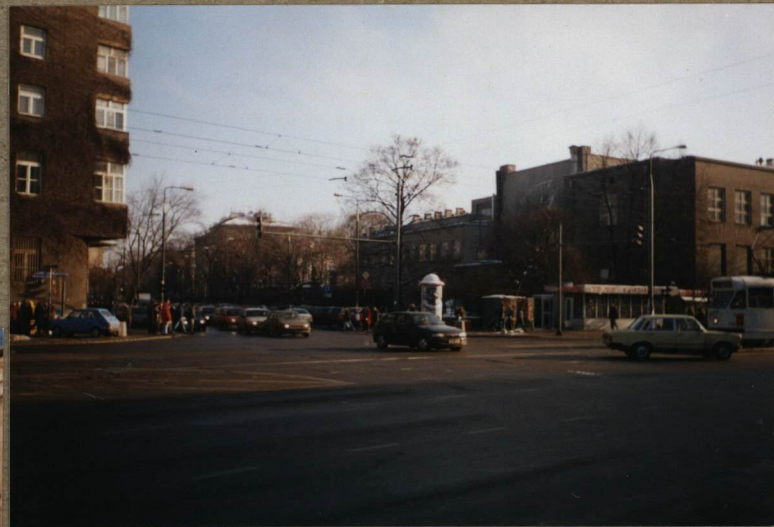
4. WIDOK NA GMACHY POLITECHNIKI NA TERENIE BYŁEGO CMENTARZA NA ROGU AL. NIEPODLEGŁOŚCI I UL. KOSZYKOWEJ.