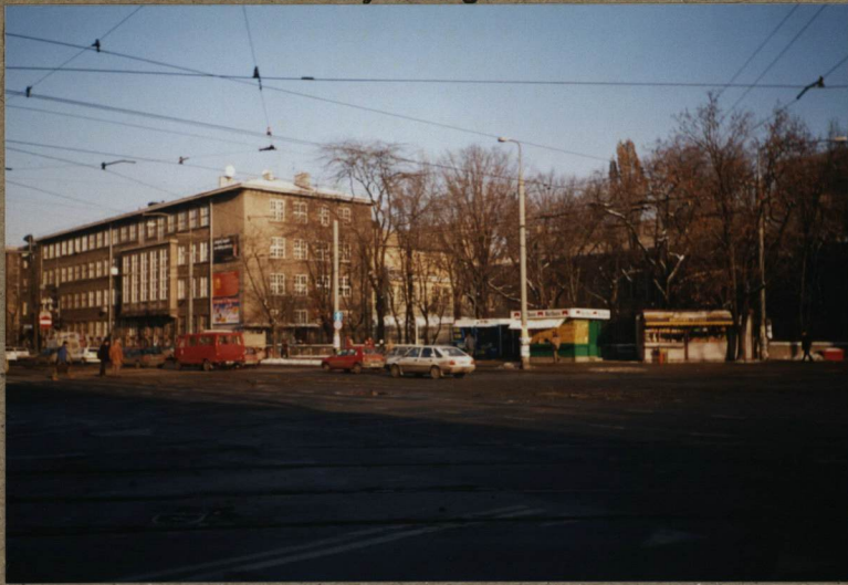
1. WIDOK NA BYŁY TEREN CMENTARZA OD AL. NIEPODLEGŁOŚCI (DANINIEJ TOPOŁOWEJ)