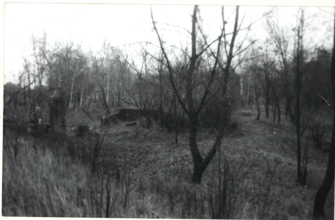
FOT. 5 WIDOK NA ZBIOROWĄ MOGIŁĘ PO ZLIKWI- DOWANYM CMENTARZU CHOLERYCZNYM