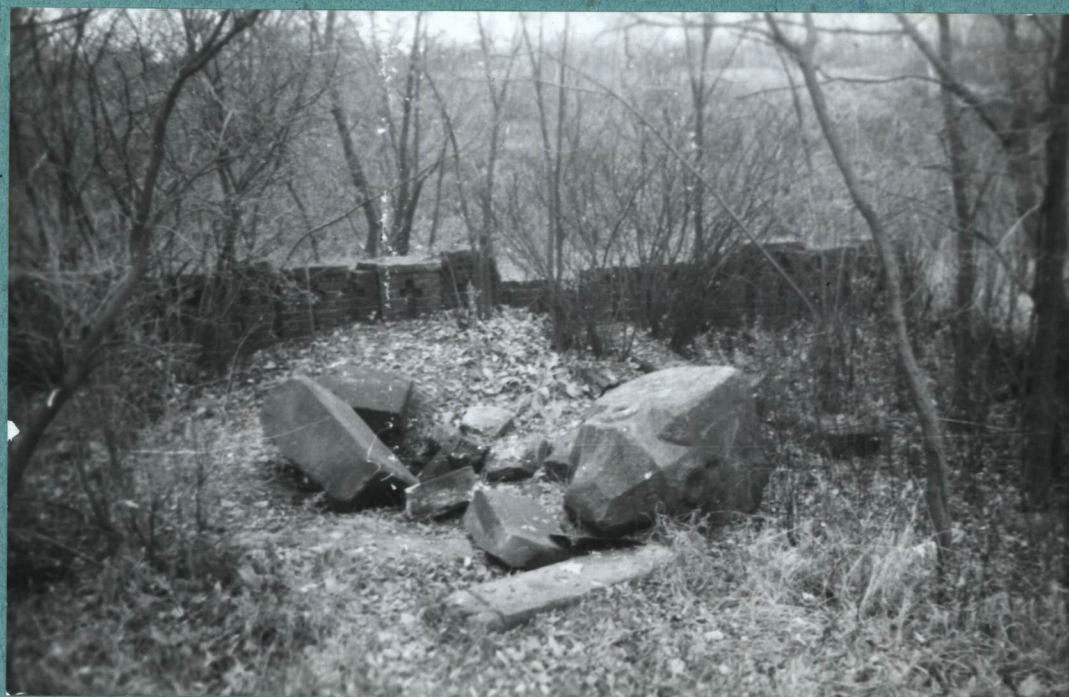
FOT. 2 ZDEWASTOWANA MOGIŁA ZBIOROWA Z 1908 R.