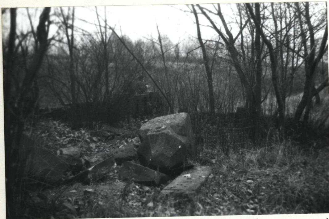
FOT. 4 ZWALONY I USZKODZONY POMNIK KAMIENNY W Kształcie stożka. INSKRYPCJA ZNACZNIE ZATARTA, BRZMIĄCA: "TU SPOOZYWAJĄ SZOŁATKI 478 OFIAR ZARAŻY CHOLERYCZNEJ Z LAT 1872-73, ZEBRANE POD WSPÓLNA MOGIŁĄ PO ZNIESIENIU CMENTARZA CHOLERYCZNEGO PRZY BUDOWIE WĘZŁA KOLEJOWEGO W 1908 ROKU"