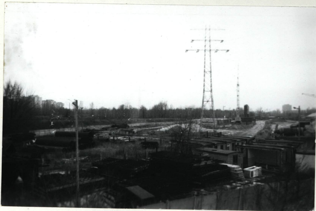
FOT. 1 WIDOK NA TEREN MIĘDZY NASYPAMI Z TORU PRZY UL. ODROWAŻA. NA PIERWSZYM PLANIE TEREN PRZEDSIĘBIORSTWA BUDOWLANEGO. ZA NASYPEM TORU - TEREN CMENTARZA. W ODDALI PO LEWEJ STRONIE OSIEDLE PRAGA III