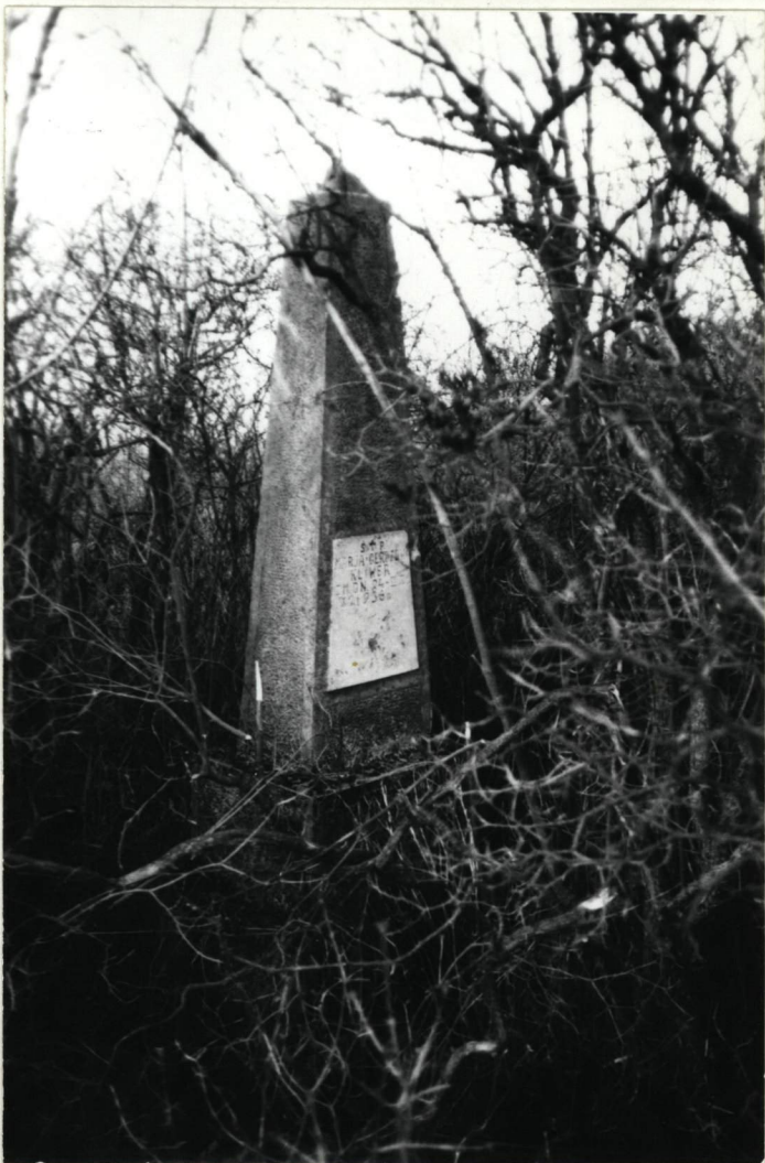
Kamienny obelisk z 1936 r.