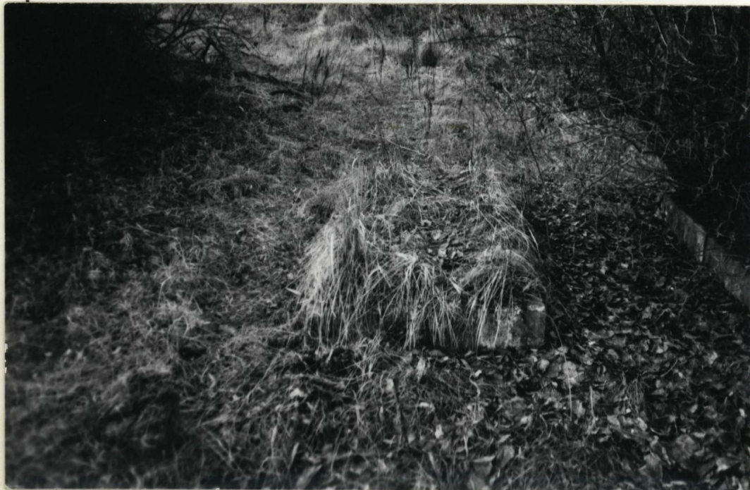
przykład zachowanego grobu w obudowie słomykowej