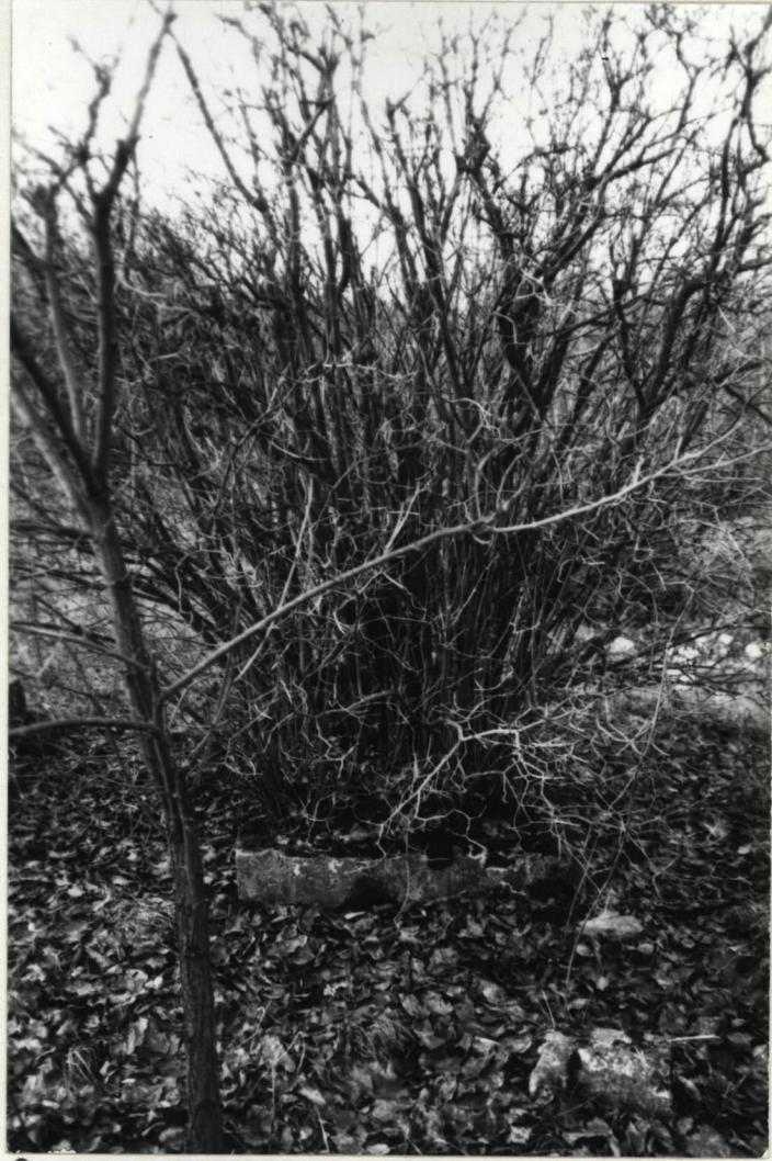
Przykład grobu w obudowie skrzynkowej