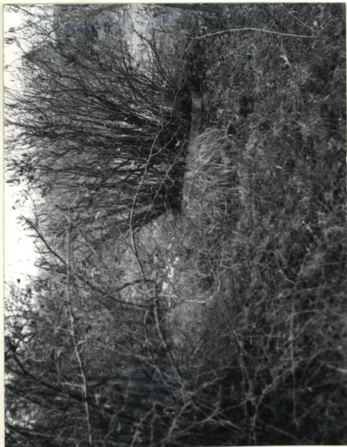
Przykład grobu w obudowie skrzynkowej