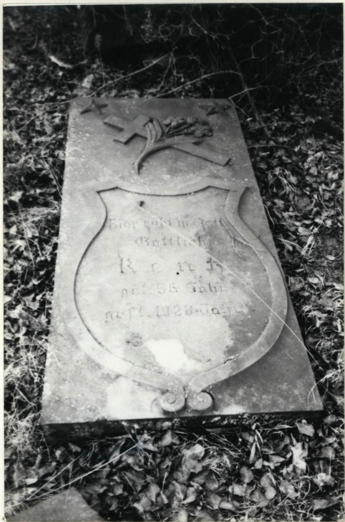
Płyta nagrobna z 1928 r.