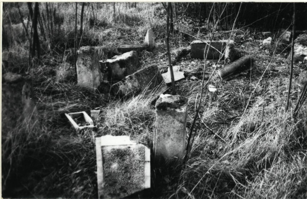
Fragmenty zdeformowanych nagrobków