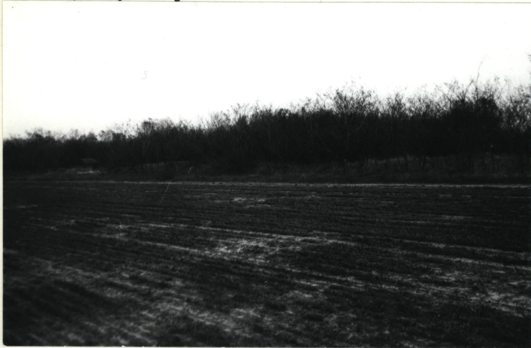
Ogólny widok cmentarza od strony zachodniej