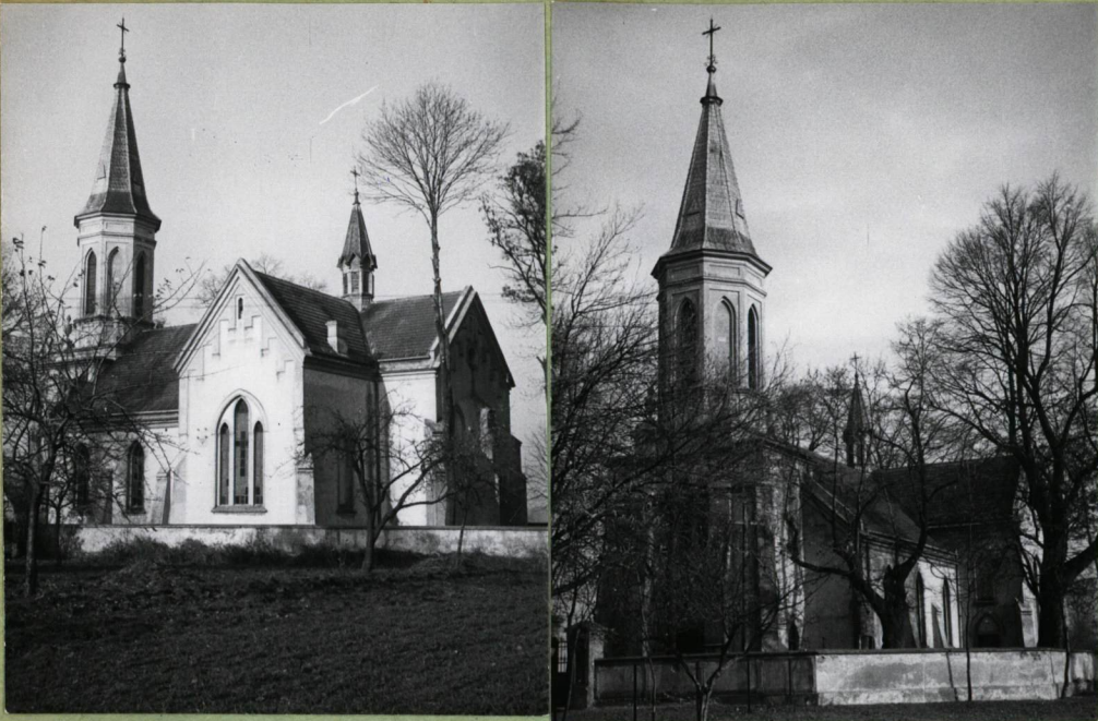
Fot. 1-2 -2.