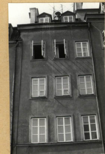
ELEW. TYLNA, FRAG.