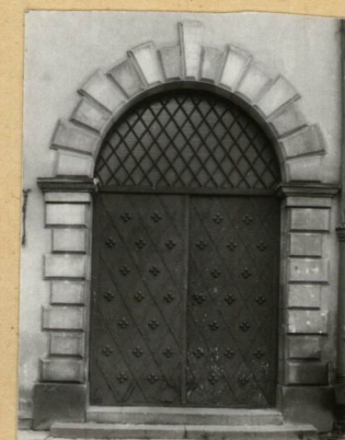
FASADA I PORTAL