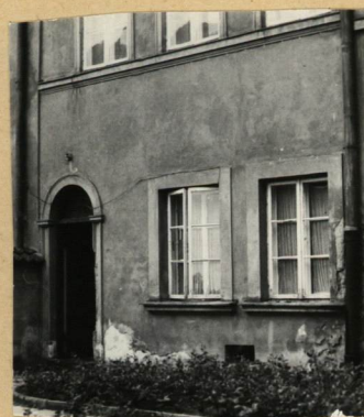
ELEW. TYLNA, FRAG.

autor zdjęć M. Maczyński data wykonania V. 1983 miejsce przechowywania negatywów U.K.M.St. Warszawy