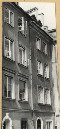
ELEW. TYLNA, FRAG.