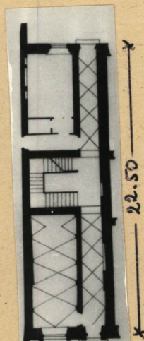
X-5.50-X RZUT PARTERU SKALA 1:400