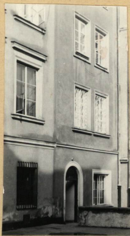
ELEW. TYLNA, FRAG.