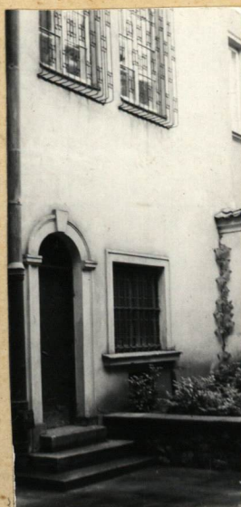
ELEW. TYLNA, FRAG.