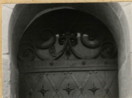
FASADA, PORTAL, FRAG. + KRATA