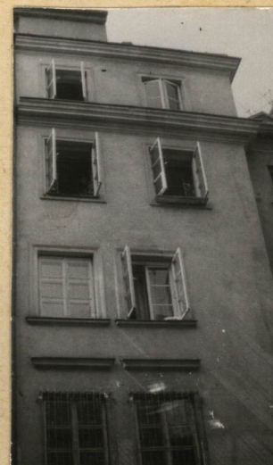
ELEW. TYLNA, FRAG.