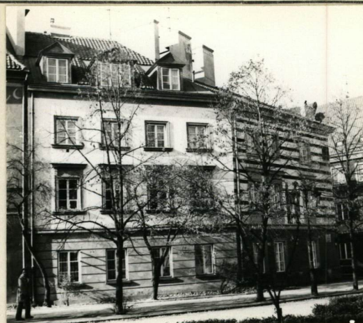
ELEWACJA OD RYNKU, PŁD - WSCH.

Jedn. Wyd. Akcyd. Olsztyn zam. 1299/5/78 OzGrafi. ZP. Ostróda zam. 1040 n. 20000