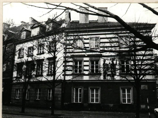
Elewacja od strony RYNKU NOWEGO MIASTA