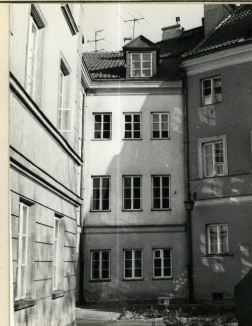
ELEWACJA OD PODWÓRZA, ZACH.